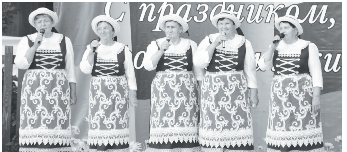
Участники клуба «Wir sind zusammen» подарили свои песни односельчанам.

памятные подарки получали семьи юбиляры, именинники, долгожители, лучшие выпускники школ.