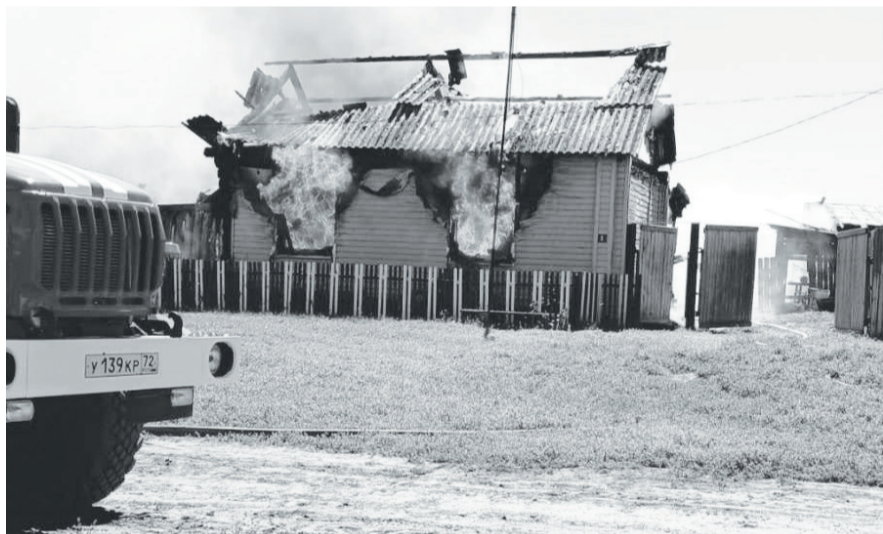
Огонь, ничего не щадя, стремительно поглощает строения.

На прошедшей неделе в районе произошёл пожар