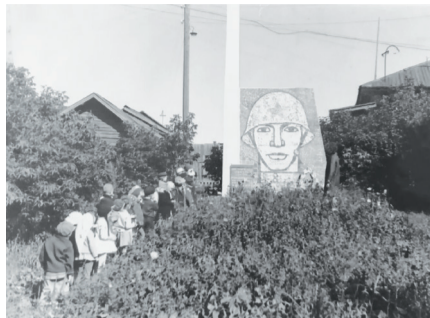
Изначальный вид памятника в 1967 году.

Как изменился памятник героям-землякам за 57 лет существования