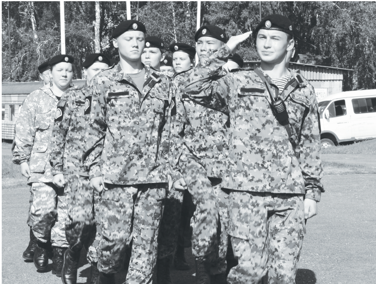
Отточенный строевой шаг юных «Упоровских ратников».