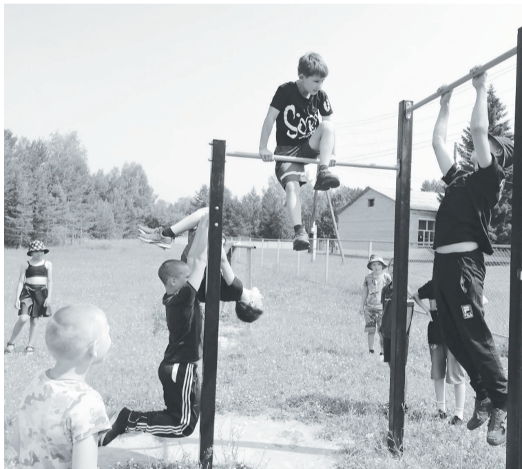
Упражнения на турнике помогают подросткам накачать мышцы.

Работа летней спортивно-оздоровительной площадки в Буньковском поселении, организованной при автономном учреждении «Физкультура и спорт», в самом разгаре. Её в вечернее время посещают 22 ребёнка в возрасте от 8 до 15 лет.