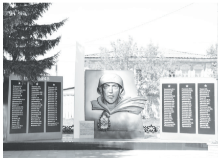
Так выглядит мемориал в 2024 году.

Подготовила Рина МИНИБАЕВА