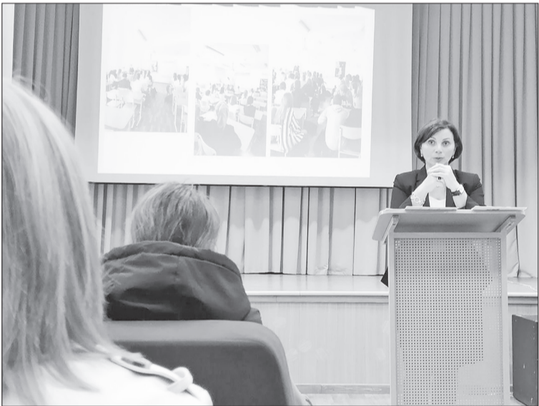
Актовый зал нижнетавдинской школы. Идёт родительское собрание.

Материальные блага. В рамках положения по антитеррору, рассказала директор, произведён монтаж откидных ворот. Увеличилось в школе ко-