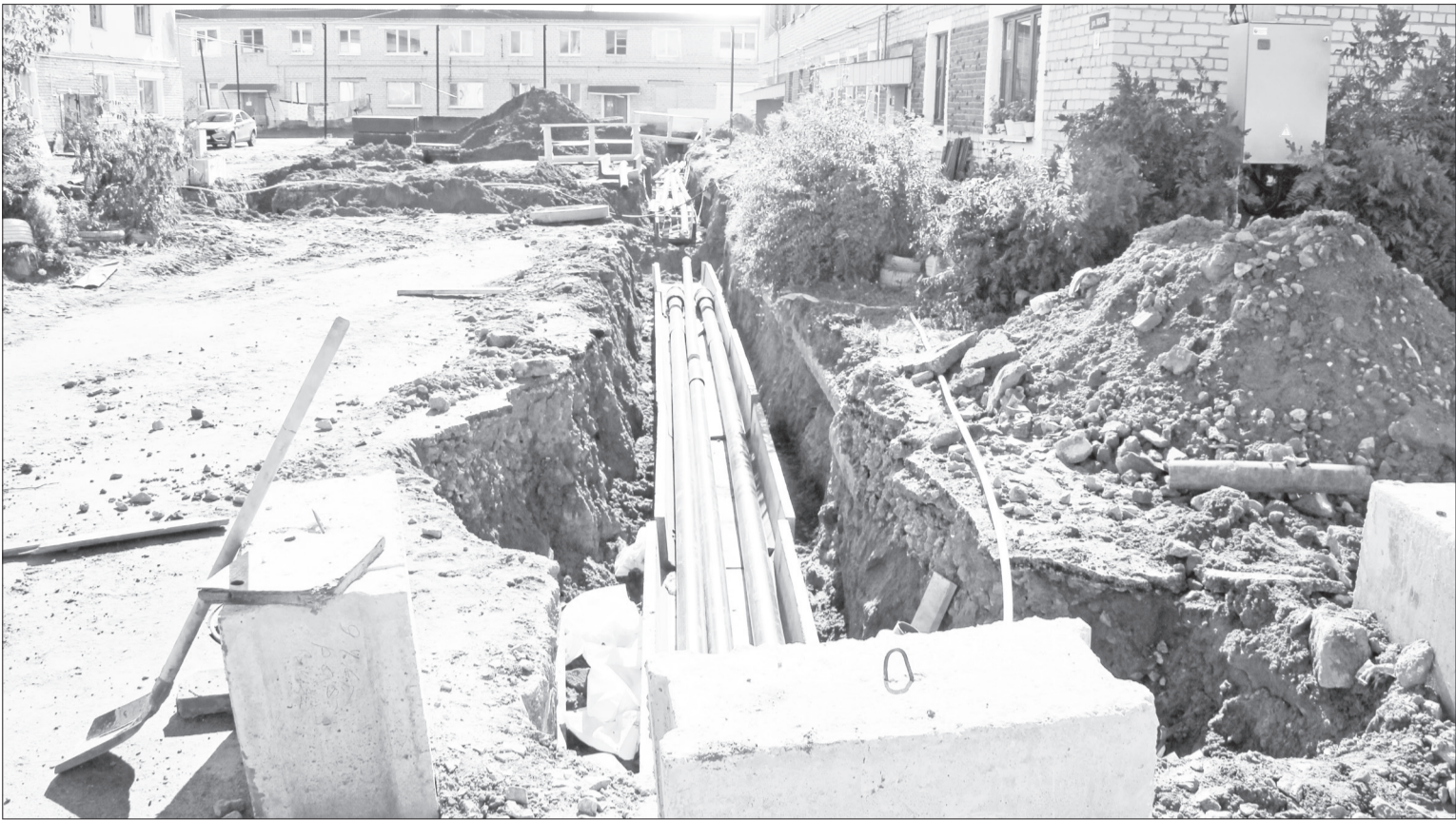
■ Такая картина наблюдается на Мира 6 и 8 в Нижней Тавде. Идёт замена участка теплотрассы. Успеют ли к началу отопительного сезона?

Финансирование одобрил Фонд содействия реформированию ЖКХ, сообщает департамент внешних коммуникаций и связей с общественностью. Такое решение принято в соответствии с представленными этими регионами реестрами контрактов. Согласно данным на сайте фонда, Тюменская область входит в перечень субъектов, которые подписали соглашения о досрочном завершении программы переселения. Этот процесс должен завершиться в 2023 году. Общая сумма средств, предусмотренных федеральным проектом «Обеспечение устойчивого сокращения непригодного для проживания жилищного фонда», направленных в регионы, составила 283,04 млрд рублей.