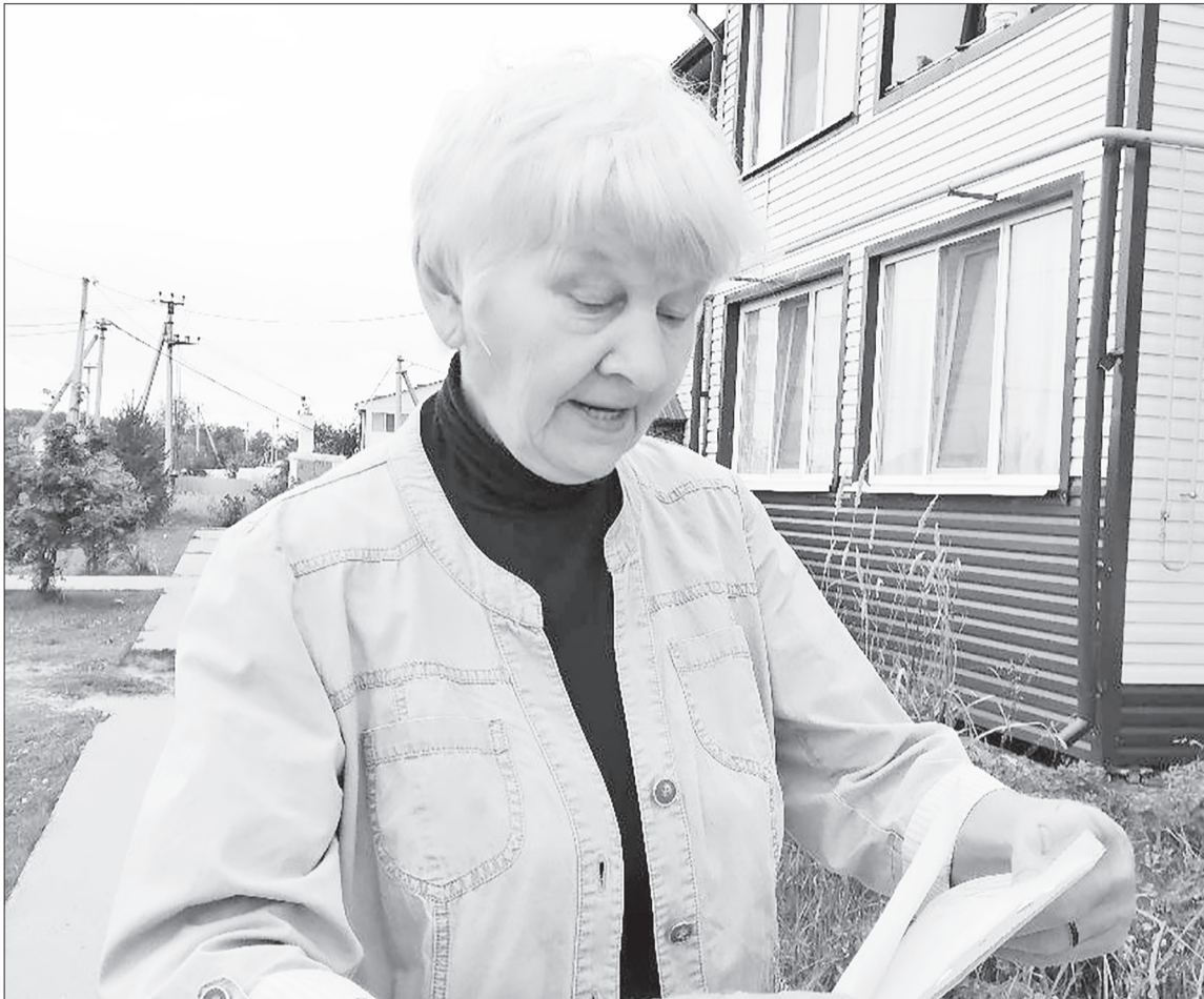
Жители дома обратились в управляющую компанию с письмом, в котором изложили проблемы, но ответа не получили.

Жители ещё одного многоквартирника рассказали о своих несчастьях