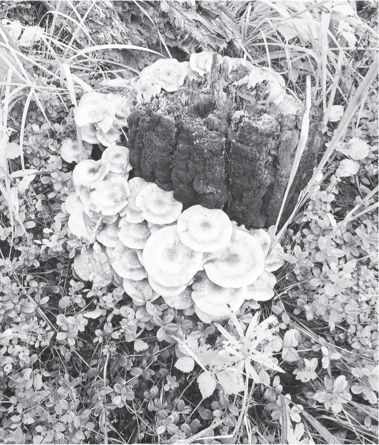
Тихая охота бывает опасной.

Как пояснили в отделе полиции с. Нижняя Тавда, лесной массив проверяется очень тщательно. С одной стороны данной территории протекает река Иска, с другой – располагается болото. К поискам