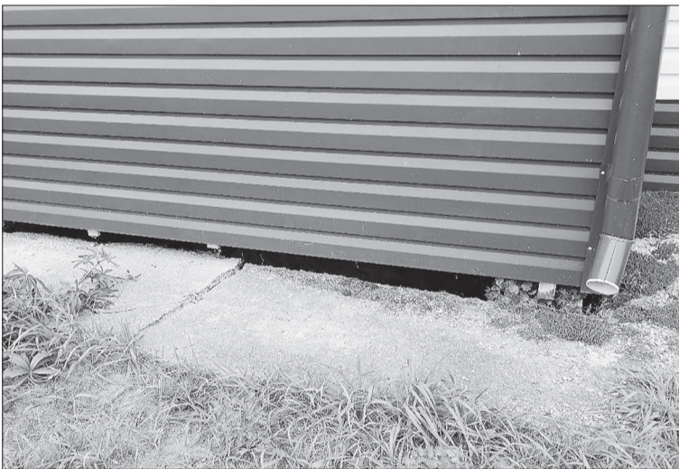
Основание дома: щели в подвал, трещины в отмостке.