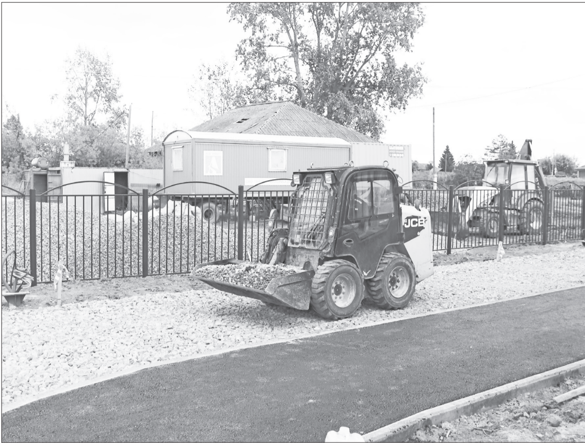
Вокруг здания строящейся Новотроицкой школы идёт благоустройство: проезжая часть отсыпается щебнем.

Школа будет небольшая, но отвечающая всем современным требованиям