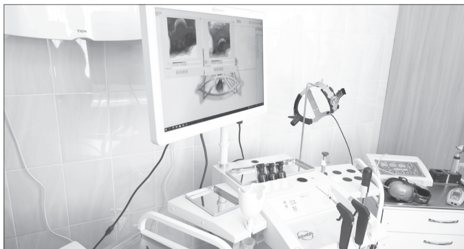
Поликлиника укомплектована современным оборудованием

Губернатору показали расположение отделений и провели небольшую экскурсию. Финансирование реконструкции, как и в случае со строительством виадука, велось из областного бюджета. Что касается автомобильной