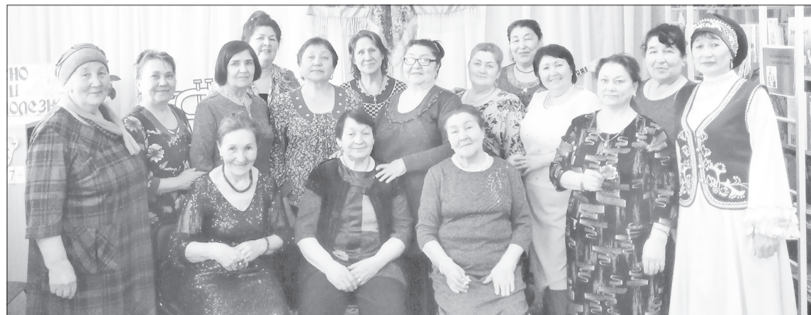
Гости праздника и организаторы остались довольны встречей

В Асланинской библиотеке состоялся литературно-музыкальный праздник