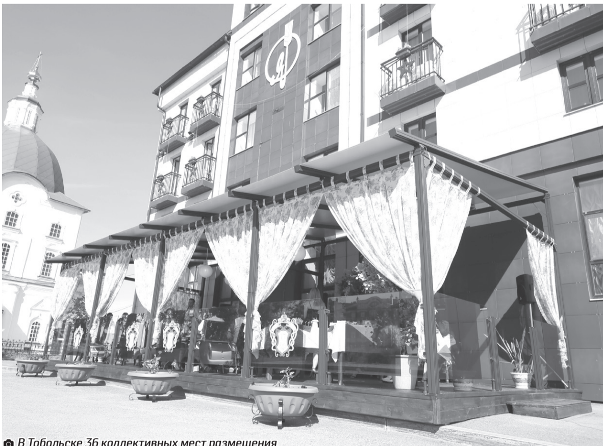
✎ В Тобольске 36 коллективных мест размещения

Особое внимание в прошлом году отводилось обеспечению санитарно-эпидемиологической безопасности учащихся в школах и детсадах, для этого были закуплены рециркуляторы воздуха, дезинфицирующие средства. Бесплатным горячим питанием обеспечены все учащиеся 1-4 классов, во время пан-