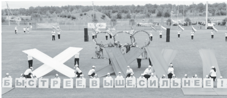
Торжественное открытие игр.

На районных спортивных играх было разыграно более четырёхсот медалей