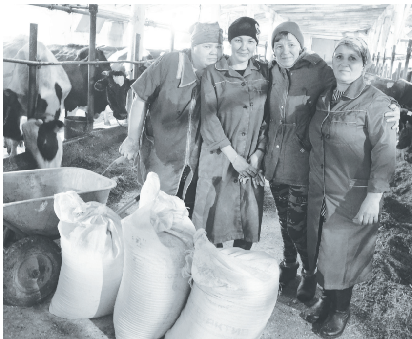
Оптимистичный коллектив животноводческого комплекса в д. Марковой.

Одно из крупнейших предприятий по производству продукции растениеводства и животноводства в Упоровском районе – ЗАО «Нива-Агро». Ответственность и самоотдача специалистов и рабочих предприятия впечатляют. Преданность своей земле они доказывают делом.