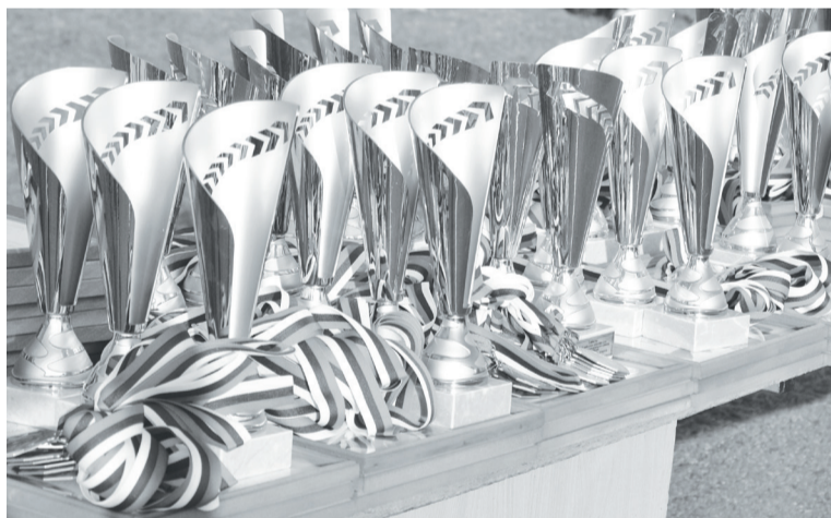
Награды ждут своих героев.