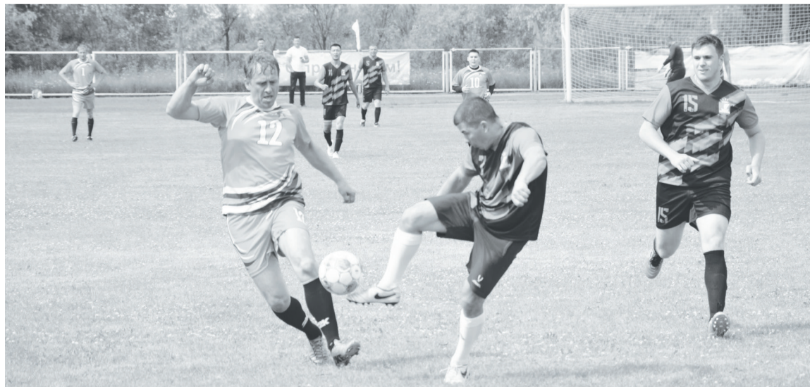
Футболисты показали много красивых моментов игры.