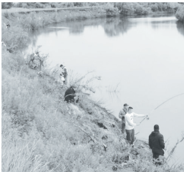
На крутом берегу Тобола расположились участники рыболовного состязания.