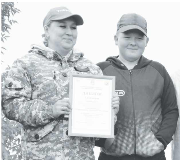
Команда районной больницы стала победителем конкурса «Ловись, рыбка, большая и маленькая».