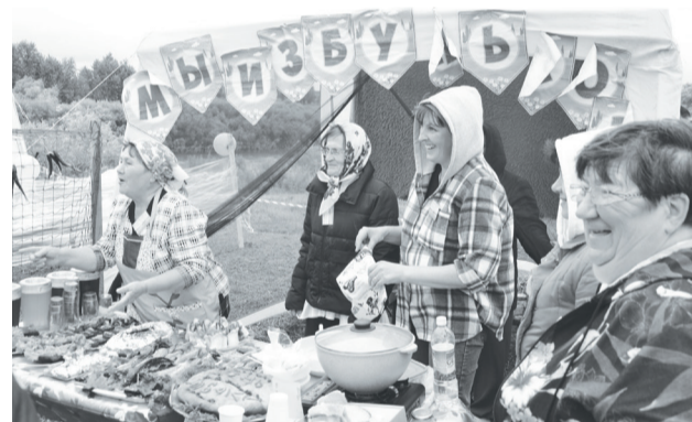
Буньковцы презентуют своё праздничное меню.