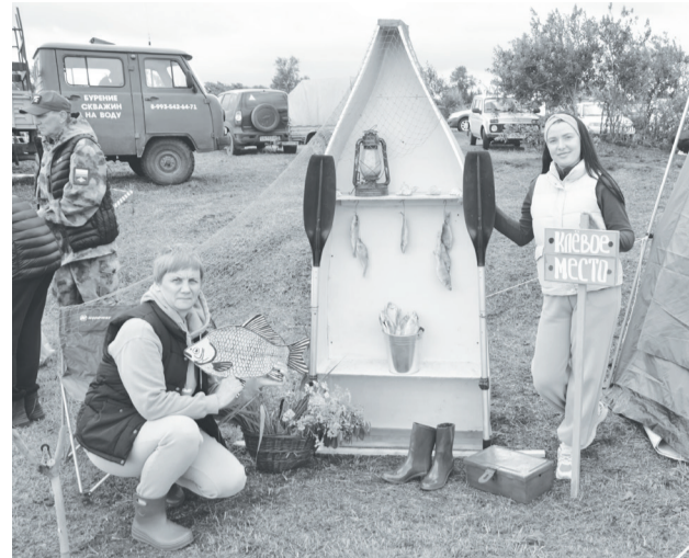
Скородумцы оформили импровизированный уголок рыболова.

Илья МОХИРЕВ