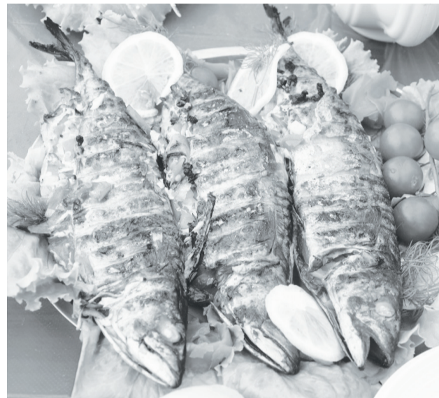
Рыбные блюда были на каждом столе.