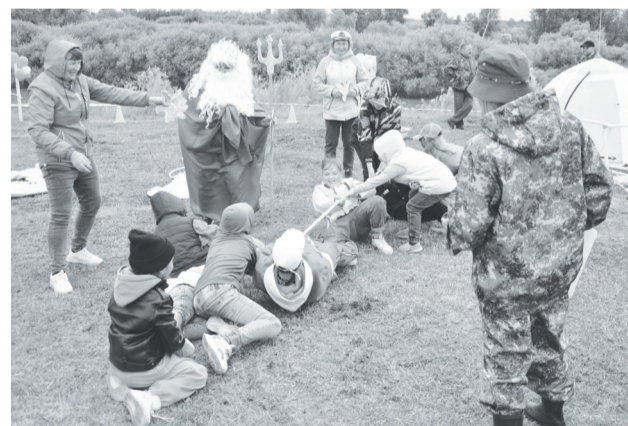
Гости фестиваля активно участвовали в весёлых состязаниях