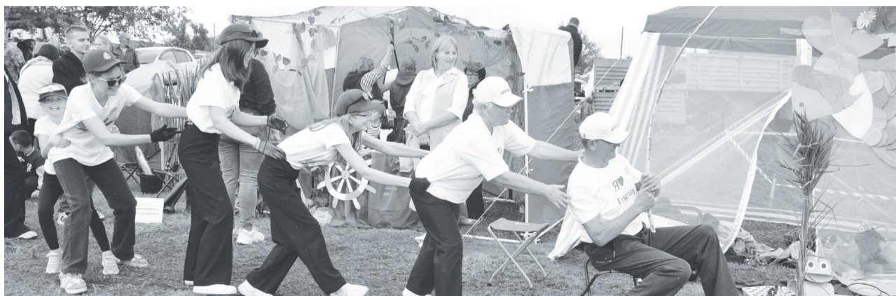
Емуртлинцы обыграли сказку «Репка» на новый лад.