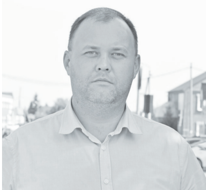
Липихи, а также деревень Московки, Осеевой, Петропавловки, Сосновки, Нифаков.

– Какая категория граждан имеет право на социальную поддержку при газификации жилых домов?