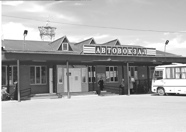
Современный облик автовокзала