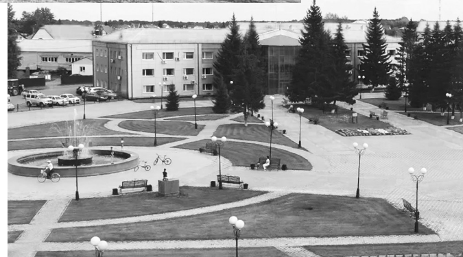
Вид сверху центральной площади – какой мы привыкли её видеть и с удовольствием проводить время в красивом месте

До 1948 года один и тот же населённый пункт носил два названия: станция Голышманово и посёлок Катышка. Указом Президиума Верховного Совета РСФСР посёлок Катышка был переименован в рабочий посёлок Голышманово. В 1950-х в нём насчитывалось уже больше тысячи дворов и свыше пяти тысяч жителей. Почти всё жильё было частным, к обществу жилищному фонду относились около 200 домов. Благоустроенными считались квартиры, в которых имелось электричество. Таких было меньше сотни. Эти данные указаны