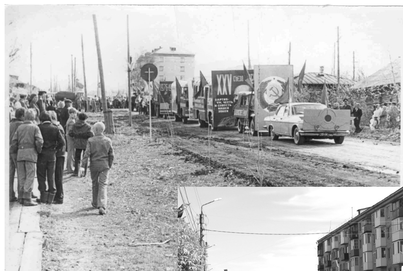
Проходит демонстрация трудящихся в 1970-х годах на улице Садовой, неподалёку от недавно построенной пятиэтажки