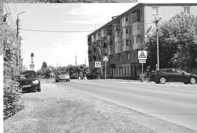
Улица Садовая и пятиэтажка спустя полвека

Голышманово сейчас – современный окружной центр с населением более 14 тысяч человек. Занимает примерно 4 тысячи гектаров. За 110 лет небольшая станция, выросшая среди лесов и болот, по-сибирски неторопливо, но уверенно идёт в будущее. Посёлок – это люди, которые здесь живут, мы часть его. И для нас он самый красивый и самый родной! И сегодня трогают за сердце стихи нашего земляка Павла Карбатова, которые были прочитаны автором выпускникам Голышмановской средней школы № 1 на выпускном вечере в 1957 году.