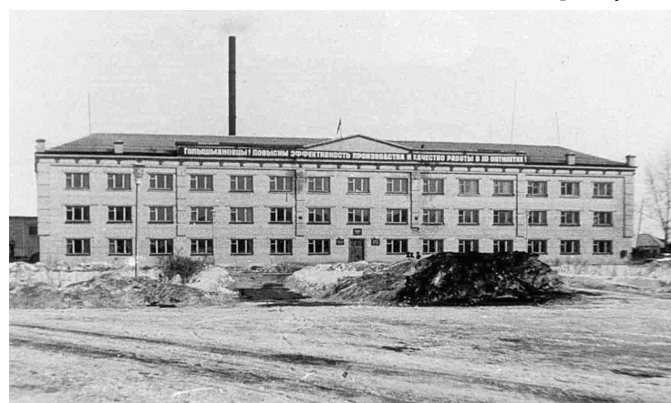
Сейчас уже не все вспомнят, что территория перед администрацией муниципалитета так выглядела

В 1950-е пошли работы по расширению железнодорожного полотна на станцию Голышманово. На память о тех днях остались в окрестностях посёлка карьеры, из которых брали грунт для насыпи. Сейчас их называют солдатскими ямами. В 1958