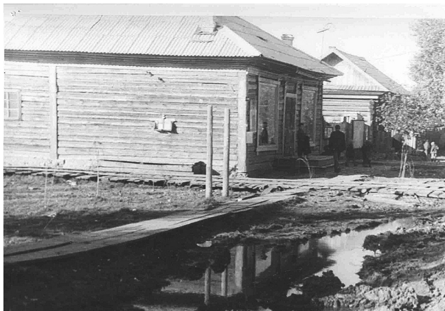
Это магазин на улице Пушкина. Узнаёте?