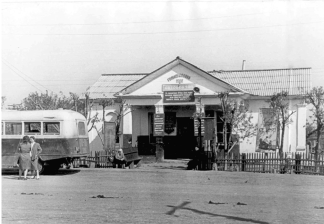
Несколько десятилетий назад здание автовокзала было таким

Масштабная тематическая экспозиция к 110-летию посёлка Голышманово в краеведческом музее знакомит с основными вехами истории нашего родного края. Показывает, как он развивался, менялся и хоршел.