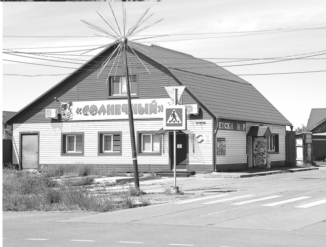
А сегодня этот участок улицы Пушкина преобразён