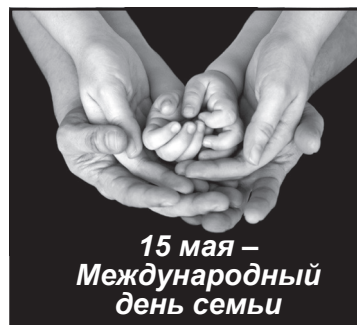
15 мая – Международный день семьи