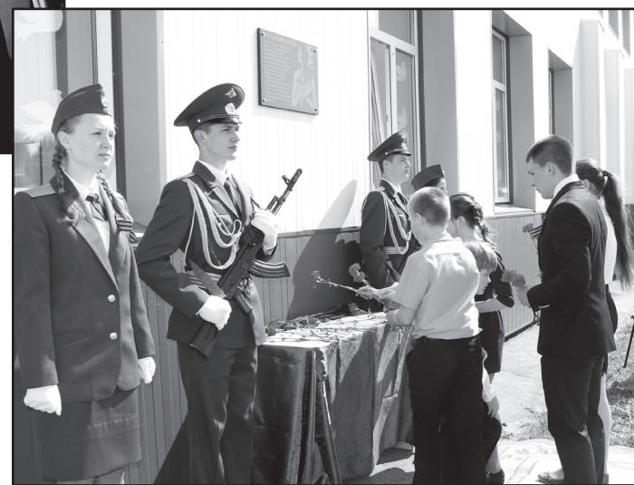
Открытие Памятной доски