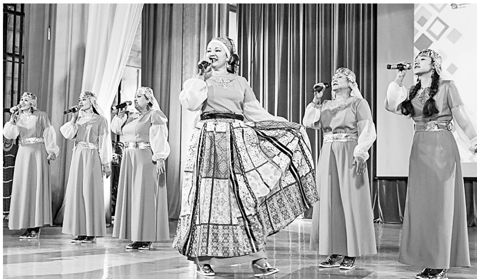
Ансамбль татарской песни «Зобержет».