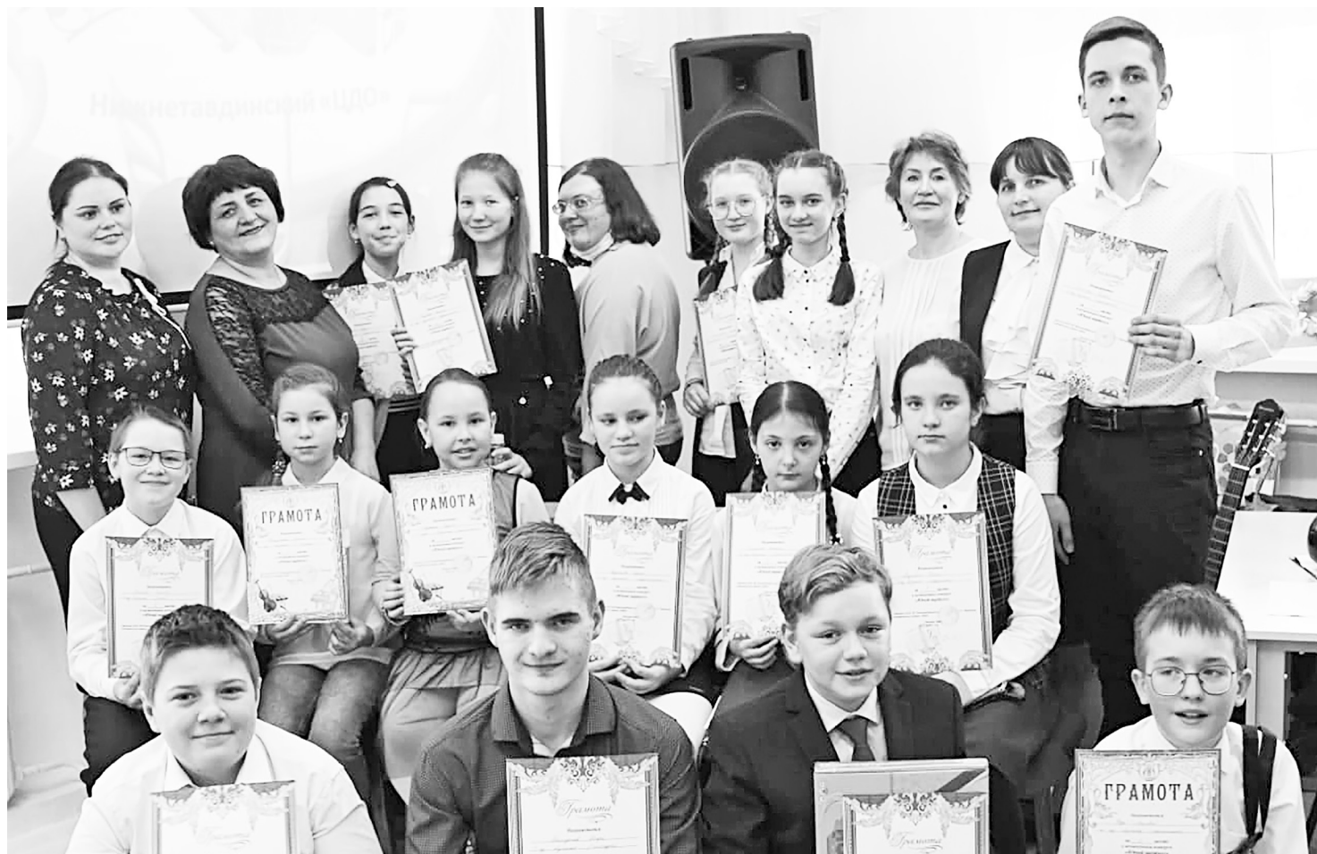
Это наши будущие музыканты – воспитанники центра дополнительного образования. Их упорству можно позавидовать.

Нижнетавдинский центр дополнительного образования впервые принял участие в этом конкурсе и громко заявило о себе.