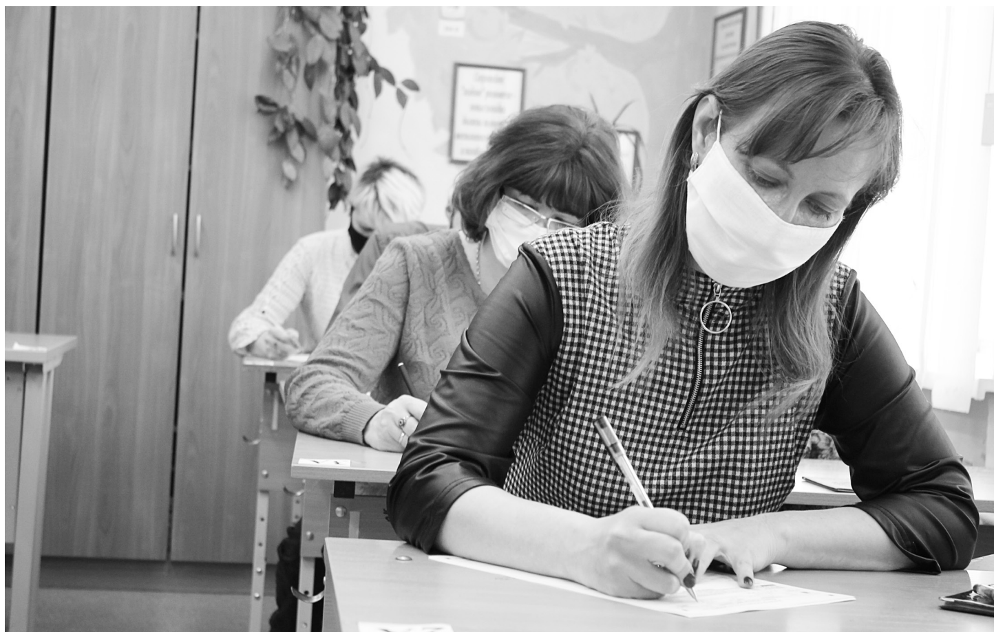
Да, непростые задания пришлось выполнить родителям. Зато теперь они знают, что ожидает детей впереди.