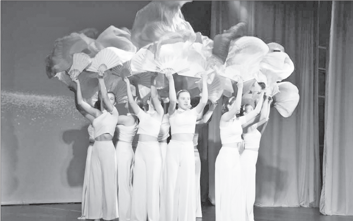
Танец с вейлами в исполнении ансамбля танца «Улыбка».

Но только концертом в зале вечер не ограничился. Все гости праздника могли посетить итоговую выставку творческих работ от объединений «Волшебная палитра», «Бисероплетение», «МУЛЬТиварка» и «Создай своего робота сам». Работала в холле «Сибири» и