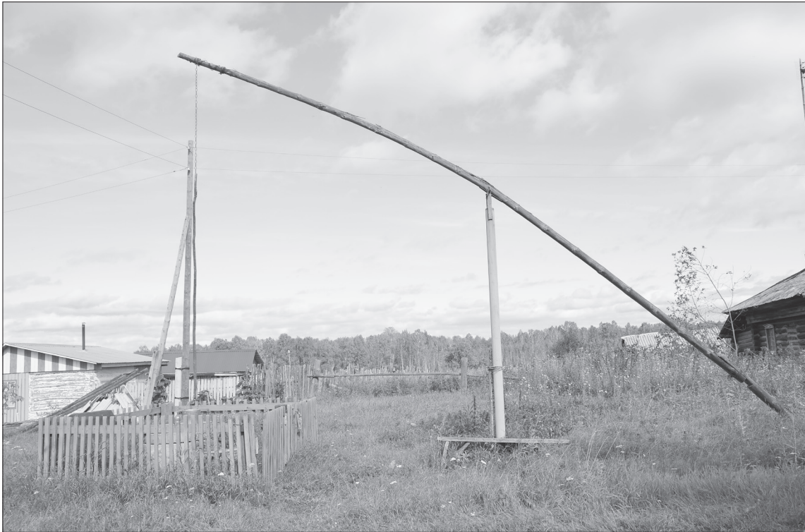
■ Петрунькино, колодец-журавль. Отголоски прошлого столетия потихоньку уходят в небытие...

На начало 1950 года по Советскому Союзу насчитывалось 255 314 колхозов, а на 1