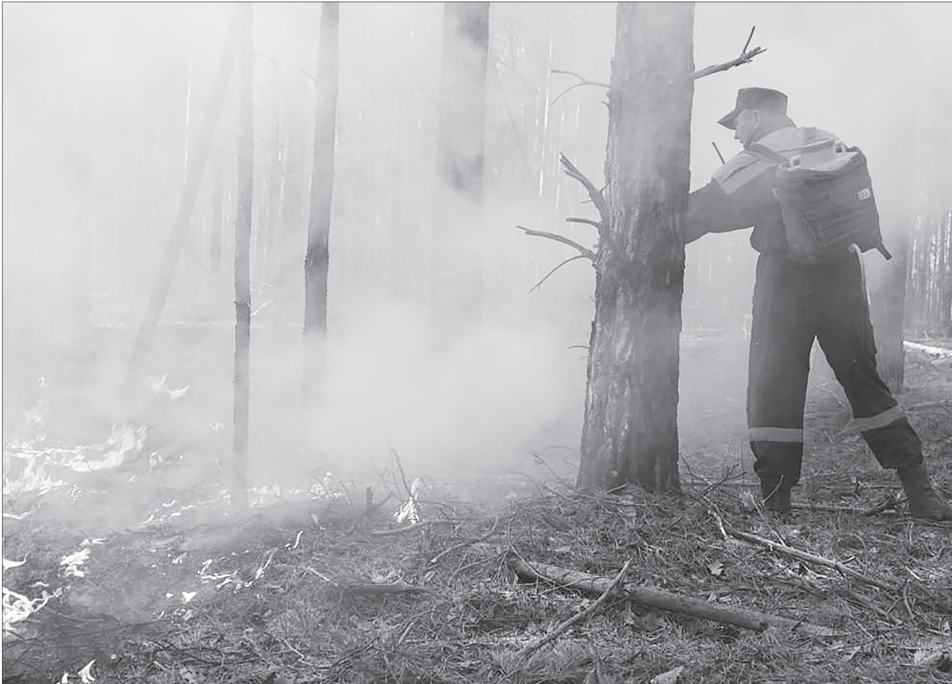
📷 Огнеборцы продолжают борьбу со стихией.

О картине с природными пожарами в Нижнетавдинском районе