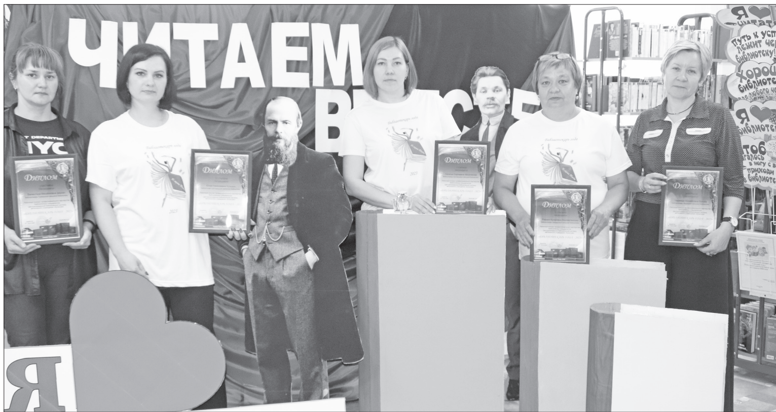
Участники районного конкурса «Библиотекарь-2023».

– Когда я работала в школе, понимала, что моя жизнь в каком-то замкнутом круге. Здесь же круг общения широк. В библиотеку приходят люди разных возрастов. И с каждым я беседую, слушаю. Я и библиотекарь, и психолог, –