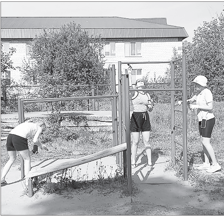
■ Благодаря коллективу социального проекта «Здоровое село» детские площадки в прямом смысле заиграли новыми красками.

– На детских площадках всё должно быть установлено по стандарту, – объяснил добротворец. – Иными слова-