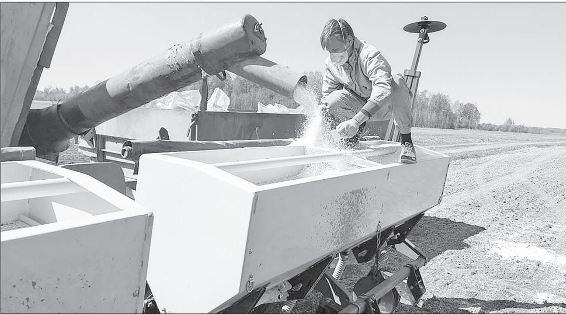
В агрохолдинге «Нижнетавдинский» кипит работа.