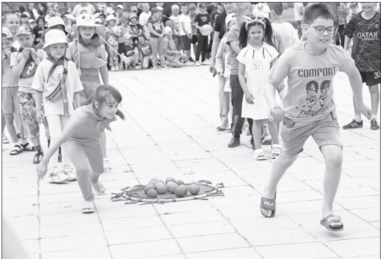
Лето начинается. Энергии, задора и веселья у детей хоть отбавляй.

Днём защиты детей начались долгожданные летние каникулы