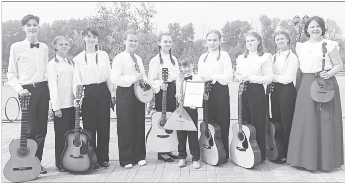
Ансамбль «Алегретто» на гала-концерте.

– Я считаю, что они нужны, поскольку показывают са-