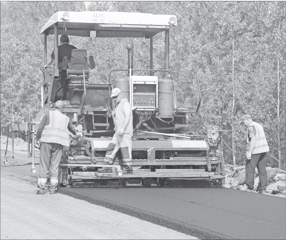
■ За Берёзовкой сотрудники ДРСУ укладывают чёрную ленту асфальта.