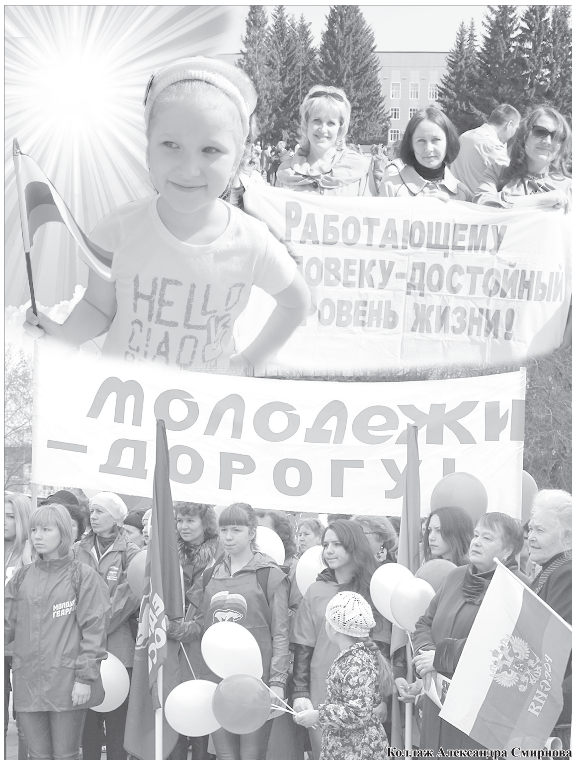
Коллаж Александра Смирнова