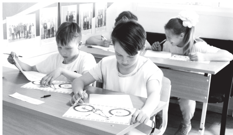
Над составными частями велосипеда пришлось подумать

На следующем испытании проверяли знание составных частей велосипеда. Кто-то скажет, что это легко, но задание содержало «подводные камни», и школьникам пришлось поломать голову, чтобы правильно всё назвать.