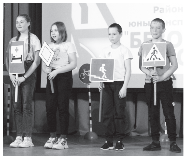
Каждая команда представила творческий номер

жестах при повороте и остановке. Но с другой – следишь за каждым своим движением, чтобы не допустить ошибку.