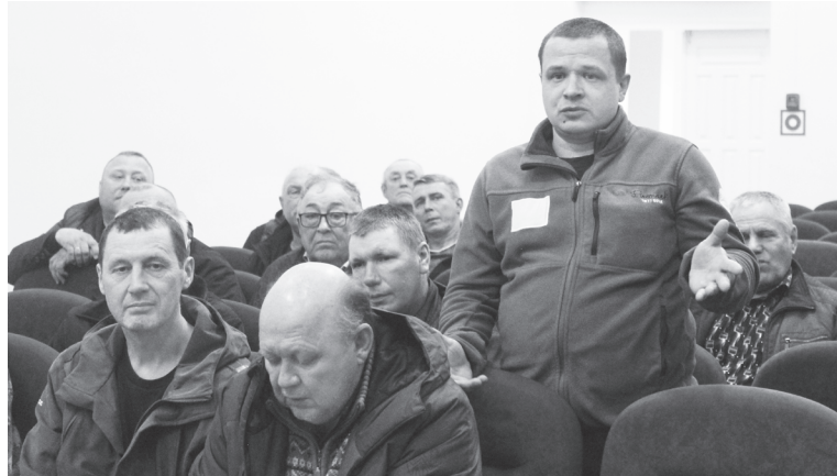
Шла оживлённая дискуссия по правилам охоты