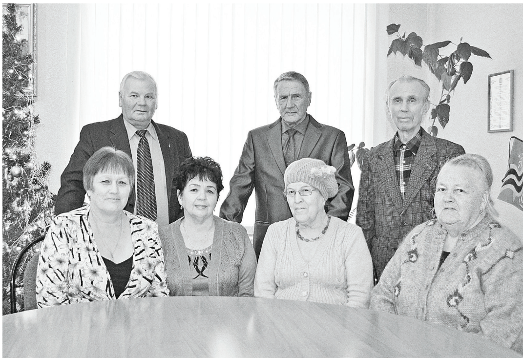
День печати – это праздник в первую очередь ветеранов газеты. Спасибо, дорогие, за годы жизни на нелёгкой стезе газетчиков, за преждевременные морщинки от свинца, за потерянное зрение, за сердечные переживания и боли, ведь по-другому вы трудиться не умели, а работать в других условиях не имели возможности. Благополучия вам, здоровья, внимания от родных. Порадуемся празднику вместе!

Главное – нас поддерживает население! Это вдохновляет и даёт силы! Перелистайте подшивку за истекший год – было что почитать, над чем задуматься, чему пора-