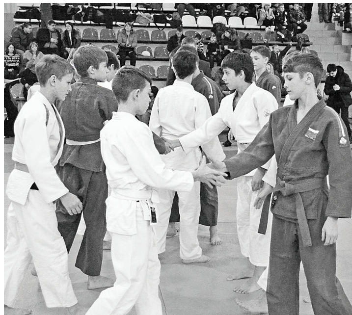
Дружеское рукопожатие перед началом состязаний команд из Нижней Тавды и Тюмени.