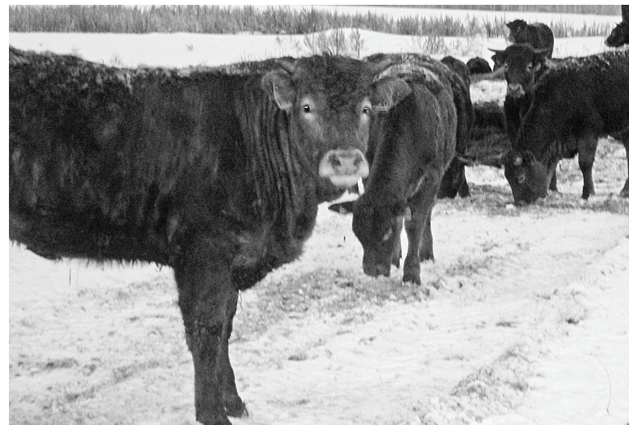
По породе, вроде, Герифорды, а обросли шерстью, как бизоны или зубры.

Не сегодняшним днём живёт ООО «Турай» в плане развития производства сельскохозяйственной продукции и решения социальных вопросов работников отрасли. Помнится, некоторые скептики, видимо, основываясь