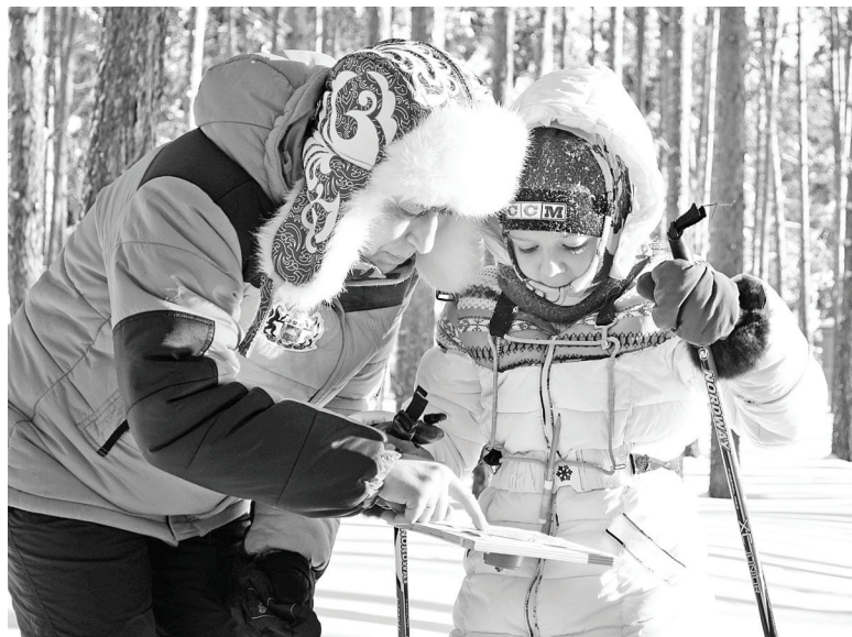
Буквально несколько секунд напутствий и – старт.

Полосу подготовили Надежда УПРАВИНА, Сергей ШКОЛЬНИК, Михаил ПЕТЕЛИН (фото)