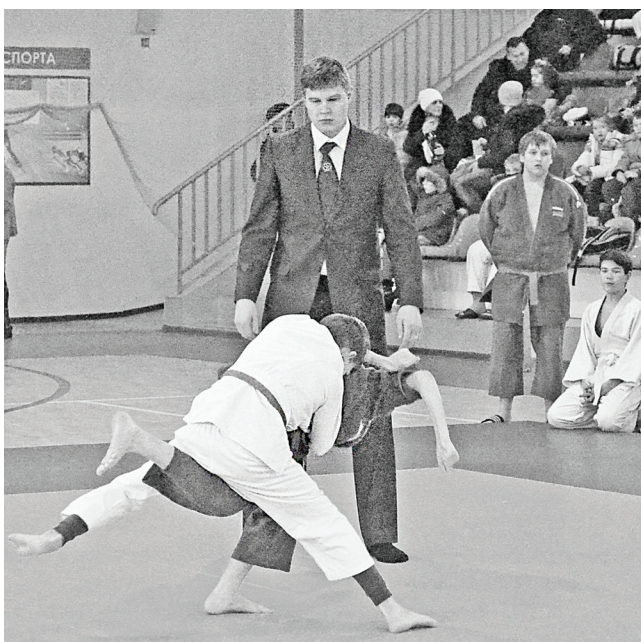
Первый бой, и сразу же мощный приём, который принёс победу нашим ребятам.

Гордится Нижнетавдинская земля подрастающими «гераклами», нынешними юными дзюдоистами, которые в очередной раз показали свою удачу, силу и ловкость, приняв участие в третьем этапе командного турнира по дзюдо «Клубный кубок нового потока среди младших юношей до 15 лет».