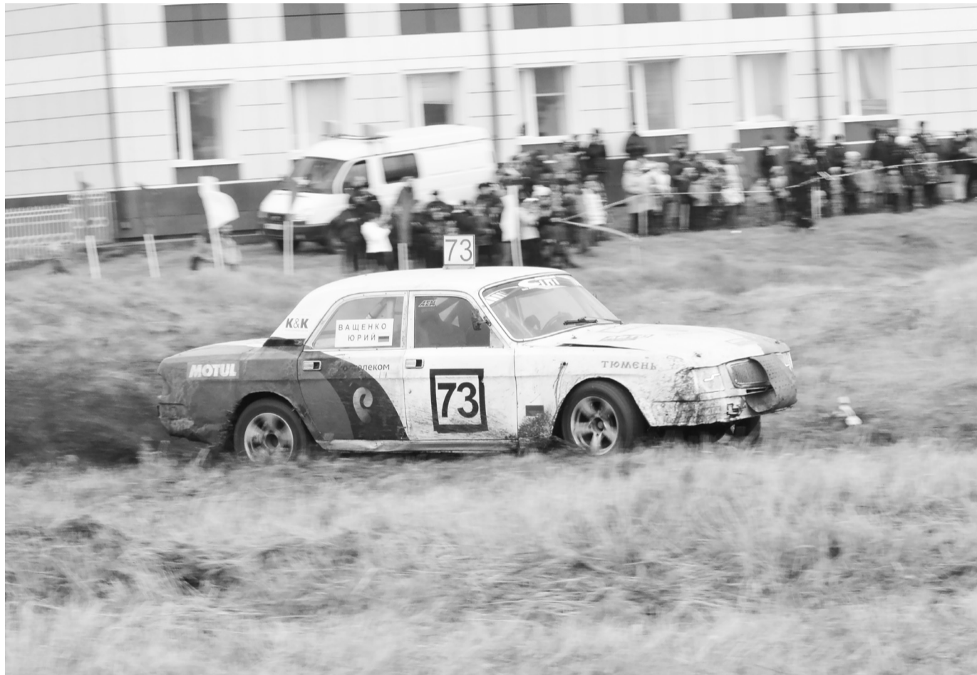
Рёв моторов, и земля – из-под колёс: нижнетавдинский автокросс получился достаточно зрелищным для болельщиков и тяжёлым для спортсменов.