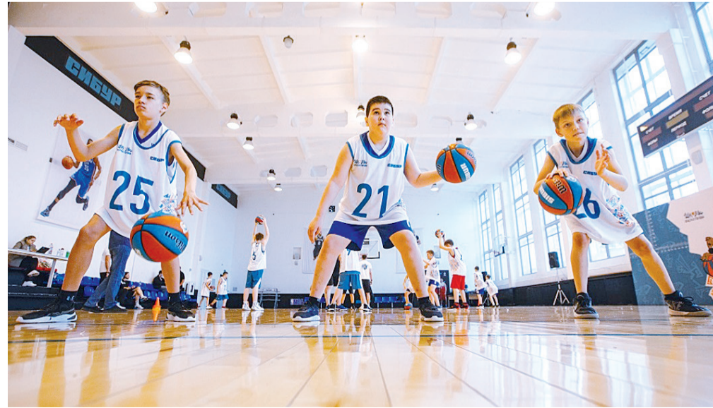
✎ Тобольские ребята — участники баскетбольного лагеря «SIBURCAMP-2021»

Спортсмены не только совершенствовали владение мячом, но и встречались со