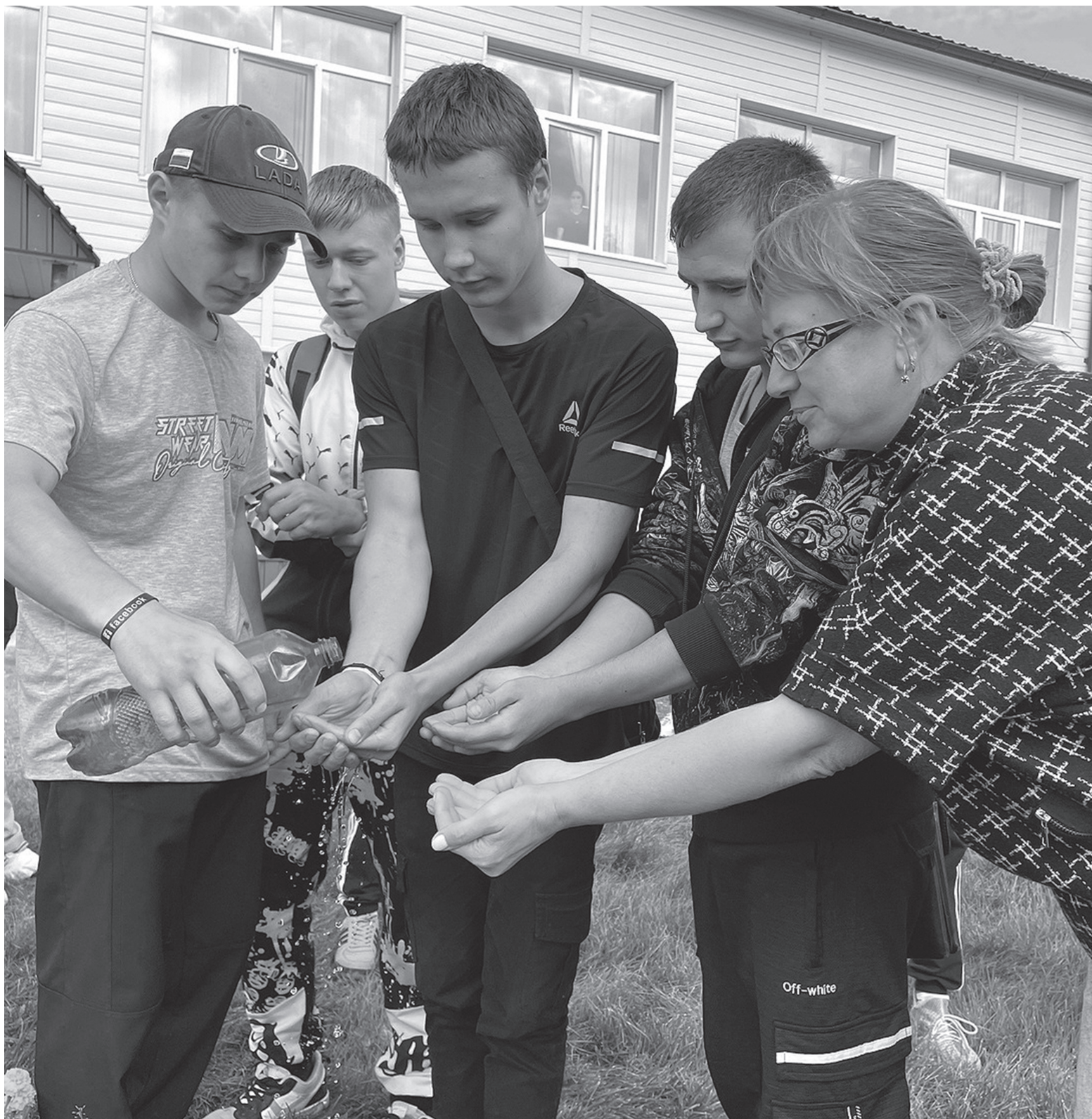
На снимке: участники акции "Капля жизни"

3 СЕНТЯБРЯ – День солидарности в борьбе с терроризмом, который приурочен к трагическим событиям, произошедшим в первые сентябрьские дни 2004 года в г. Беслане.