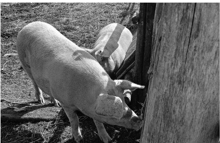
Поросята на подворье Голубцовых

Никитина вряд ли кто-то пройдёт равнодушно.