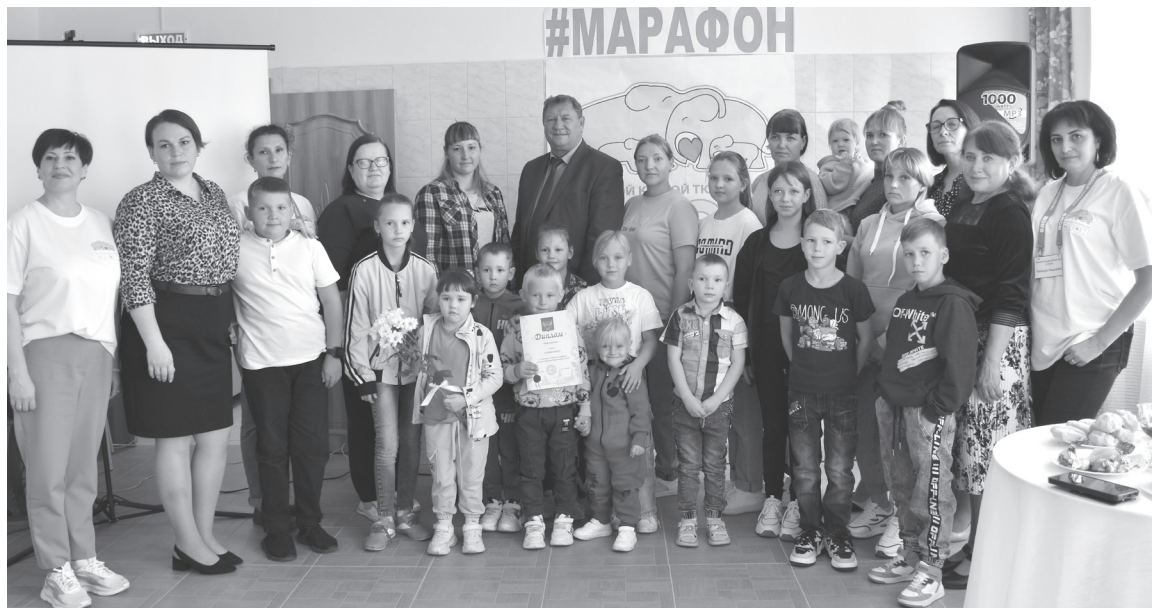
"Большой Крутой Тюменский СЛОН" подошёл к концу

пятая часть марафона, завершающая — "СЛОН", "Когда мы едины, мы непобедимы". На протяжении всего марафона с семьями военнослужащих работала межведомственная команда Сорокинского района в составе специалистов: модератора проекта, консультанта, аналитика, психолога, организатора игровой и творческой деятельности. Участники марафона — семьи с детьми, семьи военнослужащих и участники специальной военной операции — были задействованы в творческих и кулинарных мастер-классах, фотосессиях, нетворкингах и на диалоговых площадках.