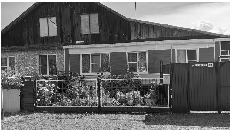
Усадьба Захаровых – самая яркая в Петровке