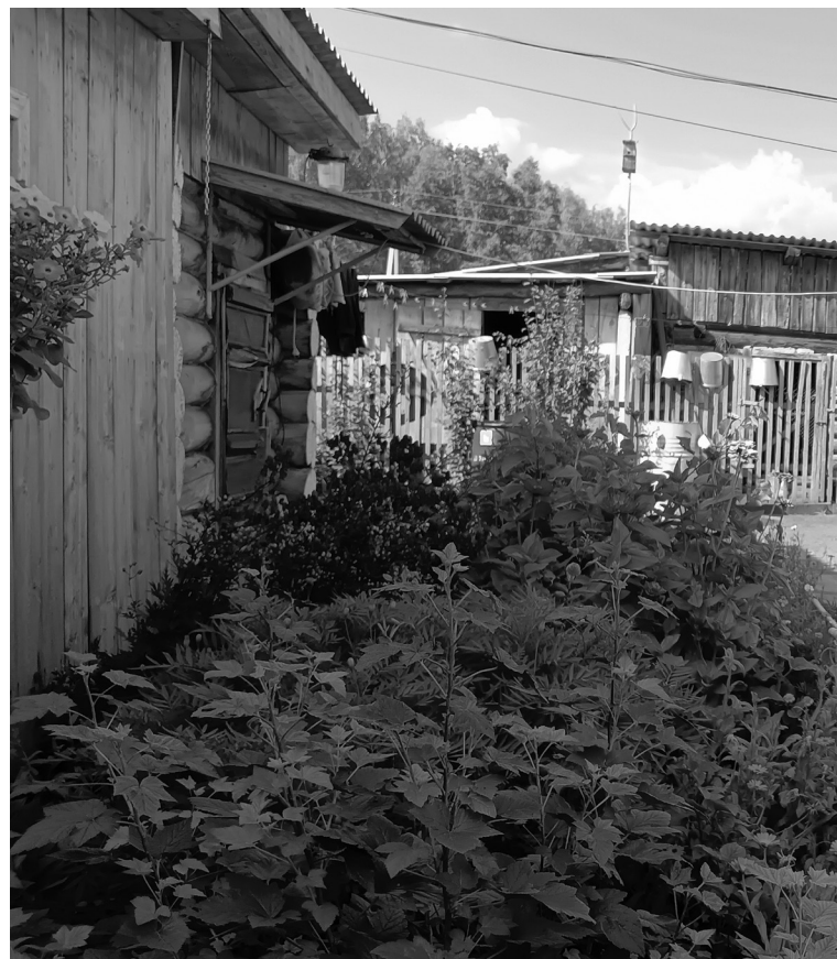
Во дворе у Дёминых

В саду зреют яблоки, подсыхает собранный