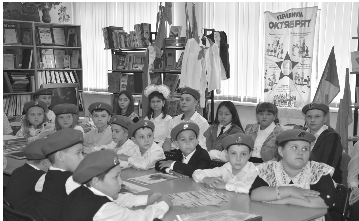
Юнармейцы школы – участники различных мероприятий в музее