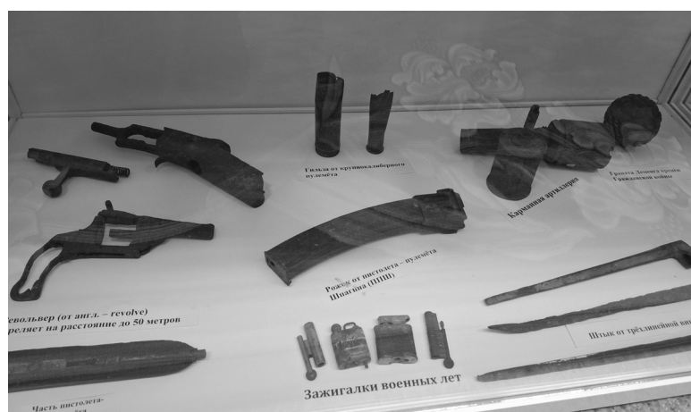
Экспонаты времен Великой Отечественной войны были найдены учениками школы в ходе экспедиций