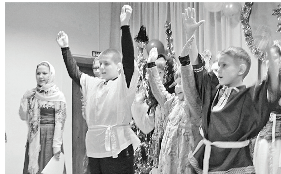
Праздник Рождества в сельском клубе подарил детям радость.

«Звонкими рождественскими песнями наполнились улицы села Новотроицкого 10 января. Это дети и взрослые вслед за Звездой Рождества отправились по селу Иисуса Христа славить. Побывали в разных домах, и везде хозяева принимали христославов, которые пели тропарь празднику, колядки, песни о зиме и главным зимнем празднике – Рождестве, с радостью. Уже второй год в рамках реализации проекта Новотроицкого сельского Дома культуры «Дорога к Храму» возрождаются традиции христианства. Тюменская молодёжь православного культурного центра «Пасхалица» (Вознесенско-Георгиевского храма) и воспитанники православной гимназии под