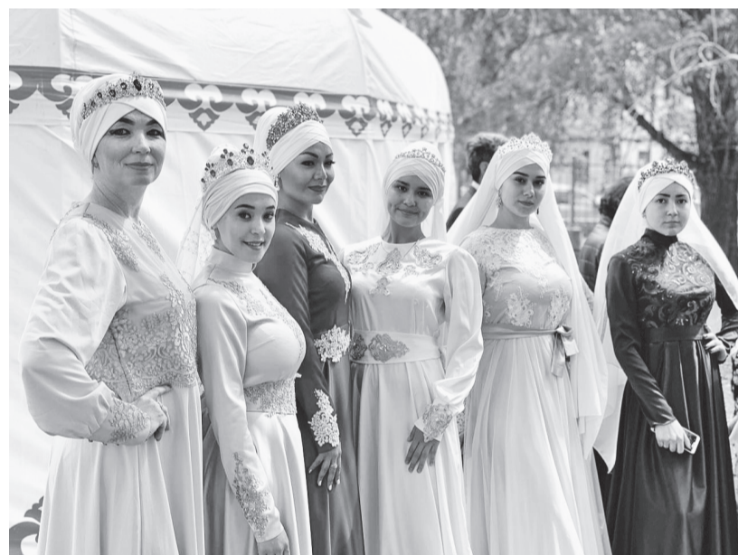
Платья на Никах

114000 руб., которые ушли на открытие павильона, закупку товара, оплату аренды и рекламы. Магазин начал приносить доход только через год. Затем последовало открытие магазина в с. Вагай, в ТЦ «Южный». Во время защиты своего бизнес-плана в администрации г. Тобольска задали только один вопрос: «Почему Вы выбрали именно эту сферу деятельности?»