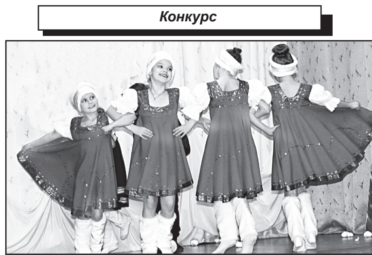
Танцевальная группа «Веснушки»

Дополняли концертное действие юные мастера художественного