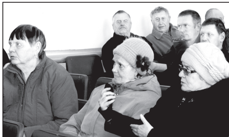
В зрительном зале: вопросы с мест

В апреле и мае провели субботники по благоустройству, в которых приняли участие жители села, организации,