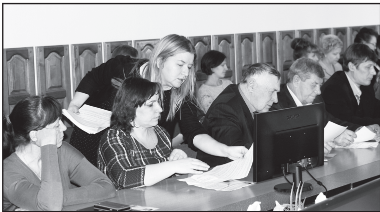
На заседании совета по развитию малого предпринимательства

Серьёзный потенциал агрокомплекса успешно реализуется. Региональное правительство, районная исполнительная власть в этом направлении успешно работают. 1 млрд 700 млн руб. вложили инвесторы в экономику района в минувшем году на строительство комплекса по производству мяса индейки. Сегодня в инкубаторе вторая партия яиц. Первая была завезена зимой – три корпуса цыплят заселили новые современные помещения, осваивают