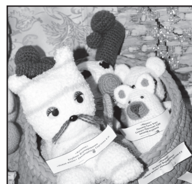
Игрушки, выполненные ребятами из Северо-Плетнёво