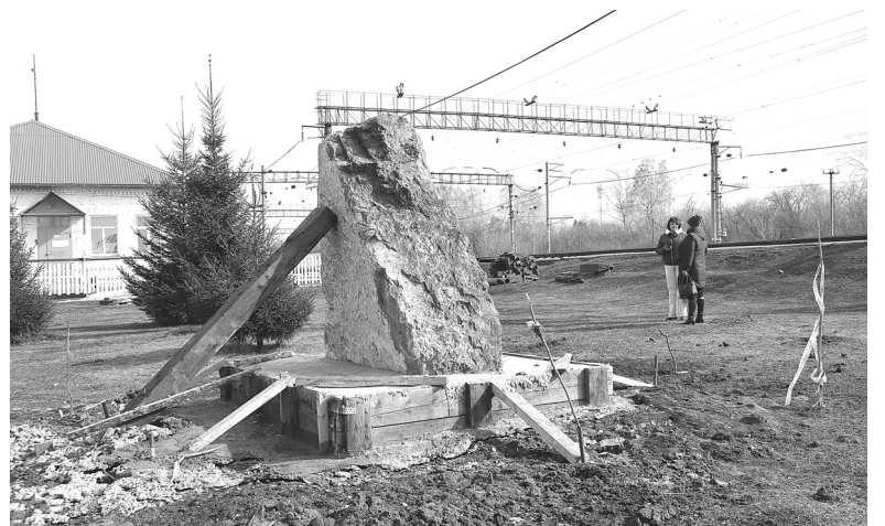
Недалеко от здания вокзала посёлка Ламенского в прошлом году железнодорожники построили постамент, на котором воздвигли памятный камень

Наталья ГЛАДКОВСКАЯ