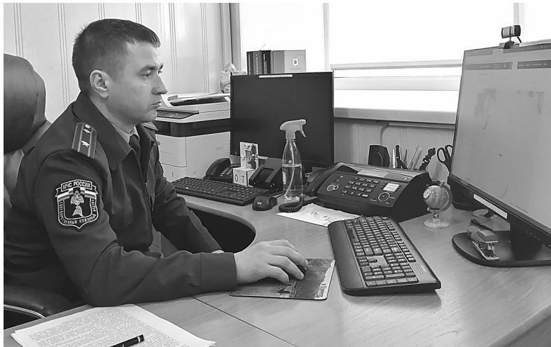
Начальник госпожнадзора Сергей Филинов показывает, что обнаружить термоточки помогает специальная компьютерная программа

– Шашлыки жарить разрешается только в жаровне или на мангале, который должен стоять на расстоянии не ближе пяти метров от деревьев