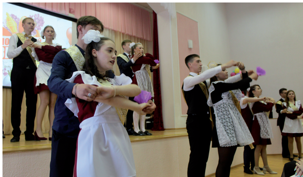
Школьный вальс останется в памяти на всю жизнь.