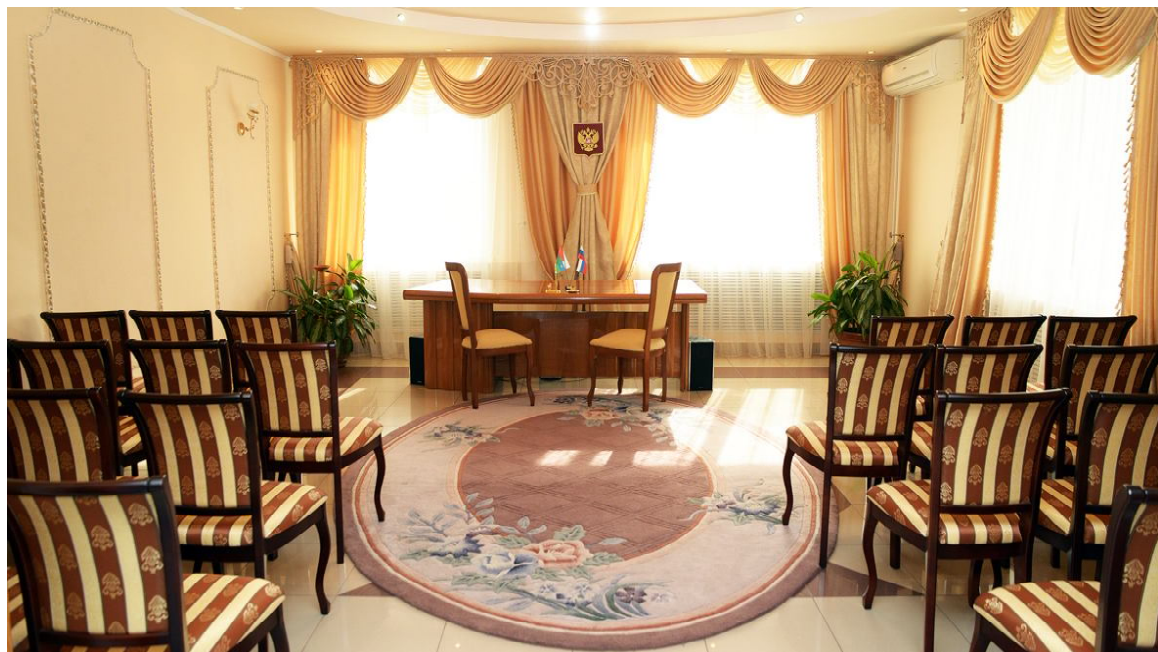
В зале торжеств Омутинского отдела ЗАГС вальс Мендельсона зазвучит только летом