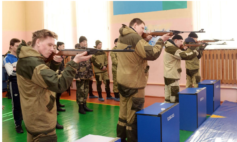
Главное, чтобы не дрогнула рука

В рамках проекта «Отцы и дети» на базе Физкультурно-оздоровительного центра и Детско-юношеской спортивной школы состоялись первые районные соревнования по огневой подготовке.