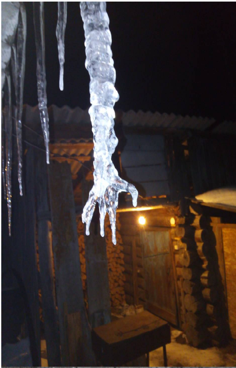
› Вот такое чудо, свисающее с крыши дома, увидела Тамара Плесовских из Викулово