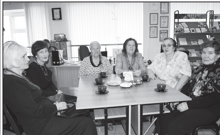
«Друзей моих прекрасные черты»