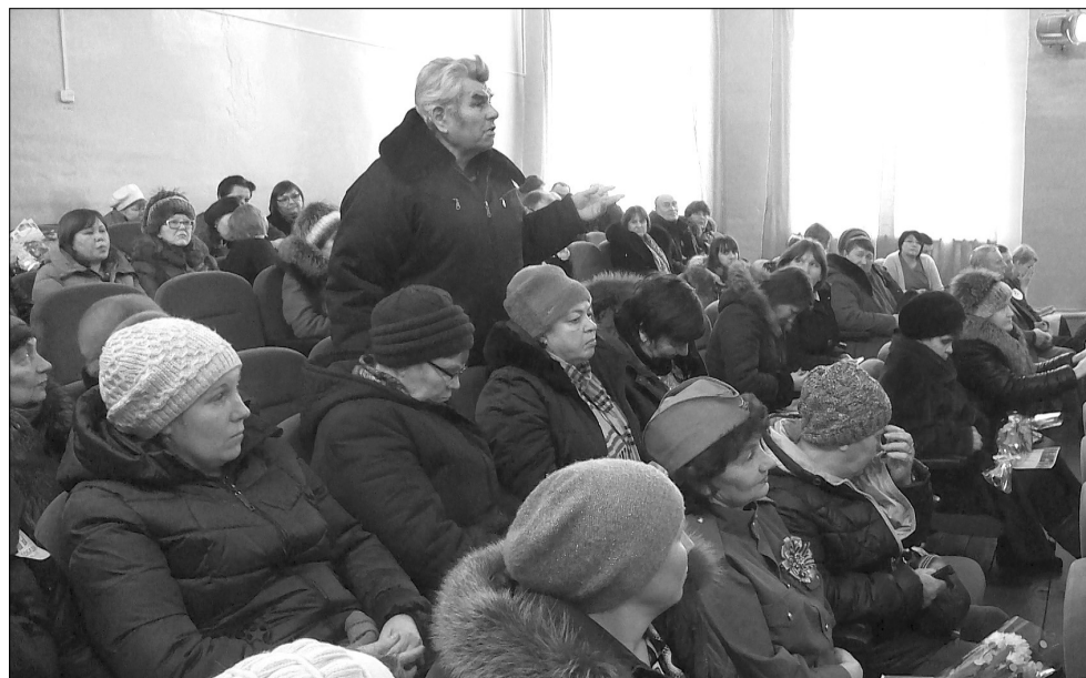
Боровлянский сход граждан прошёл в полном зале

Жители деревни Алексеевки спрашивали, могут ли они посещать лесной массив, собирать дикоросы, ведь теперь этот участок в аренде у охотпользователей. Местных успокоили, сказав, что по лесу они могут спокойно передвигаться, собирать грибы и ягоды. Действует запрет на посещение леса с ружьём без разрешительных документов. Также отдыхать в лесном массиве запрещено в период осо-