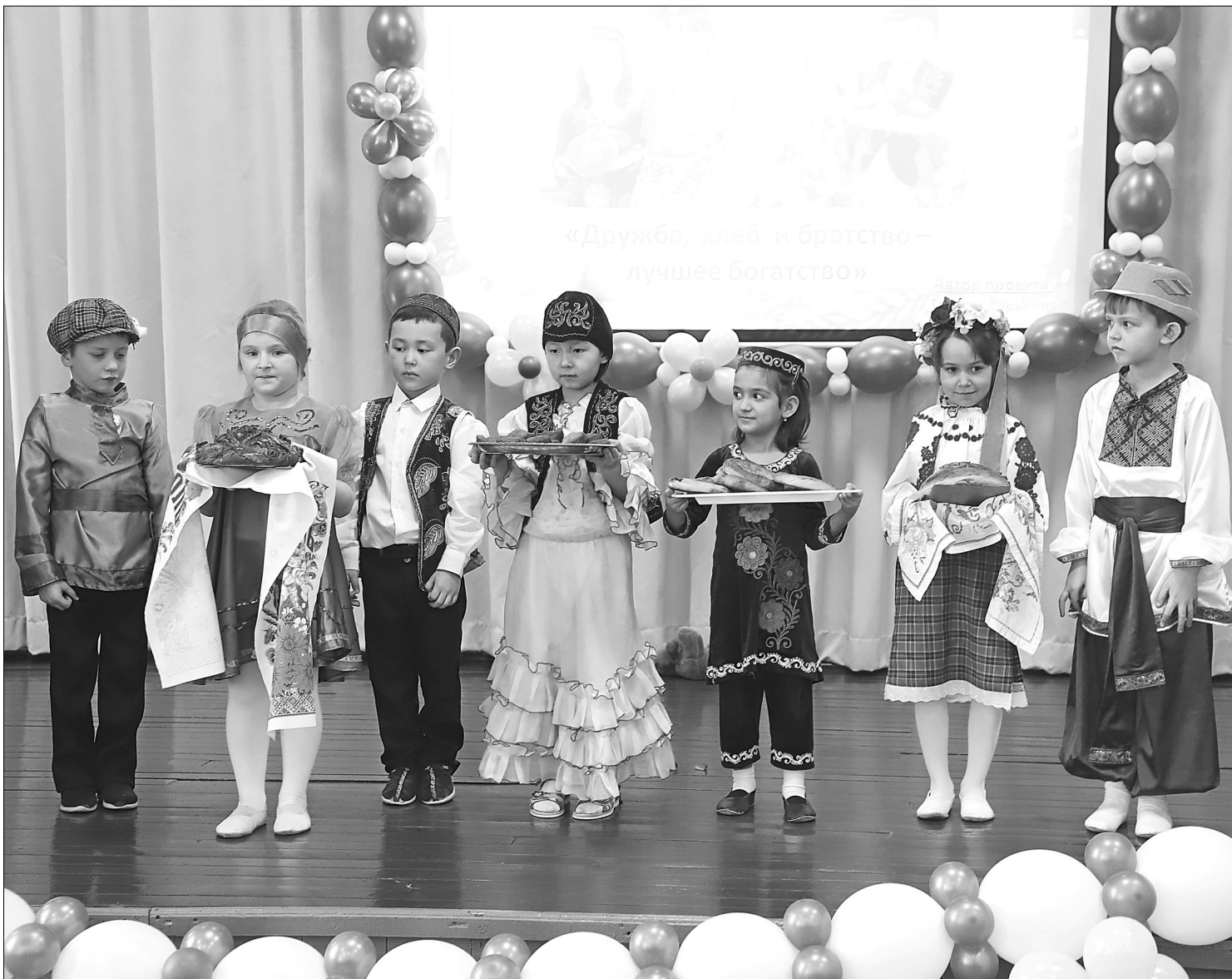
Земляновские дошкольники призывали все народы жить в дружбе и угощали национальными хлебами