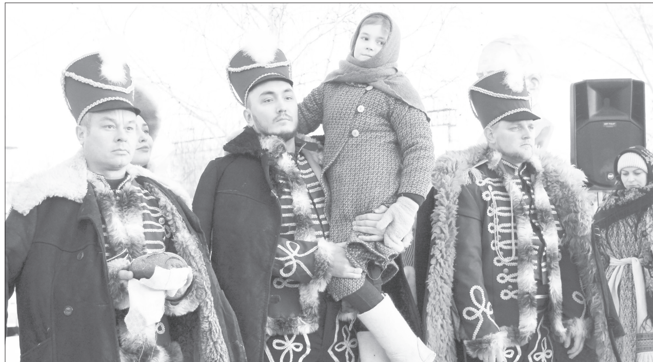
Местные традиции и обычаи волей-неволей стали близки и понятны столичным дворянам