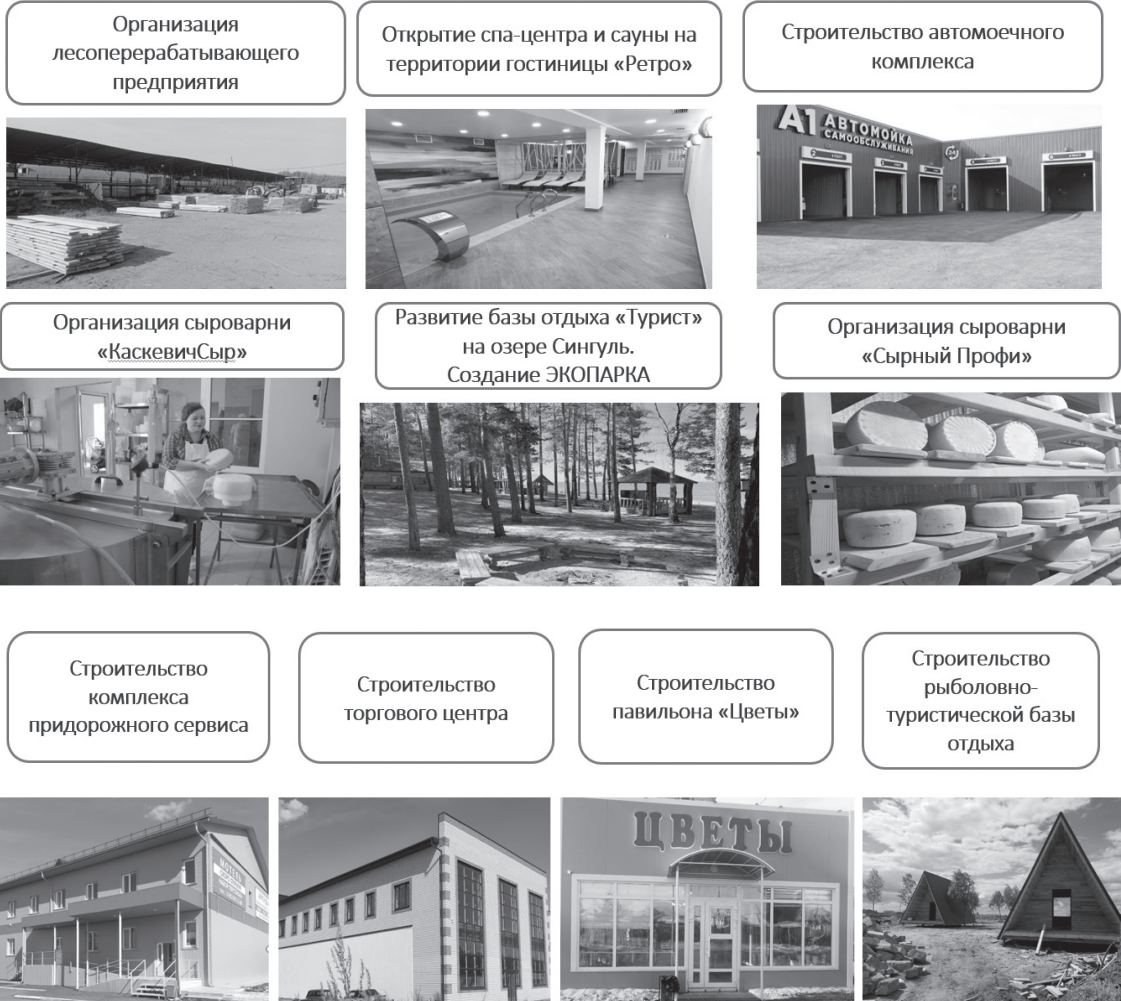
Десять новых объектов появились в городе благодаря малому и среднему бизнесу /СЛАЙДЫ ИЗ ПРЕЗЕНТАЦИИ