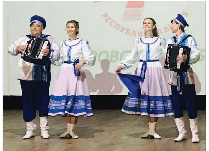
• Задорные наигрыши и русские дробушки представили аромашевцы на фестивале.

Мы смогли сравнить свою подготовку с уровнем других участников. Могу сказать, что, с одной стороны – нам есть к чему