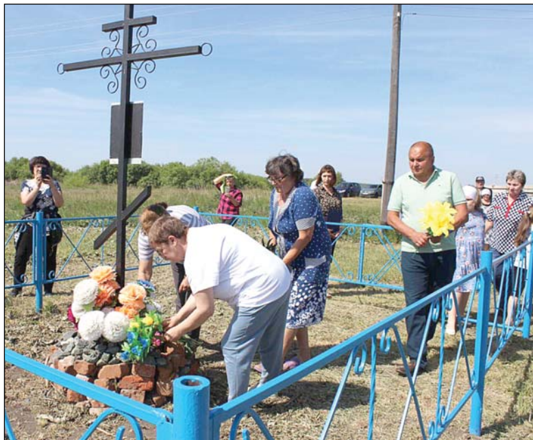
• Жители Юрминки возложили цветы у поклонного креста в память погибших 50 лет назад односельчан.