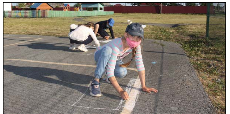
Детвора с удовольствием участвовала в конкурсе рисунков на асфальте.

Количество ребят на дворовой площадке с каждой минутой