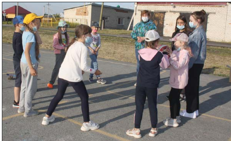
На дворовой площадке ребята проводят время в играх и весёлых развлечениях.

Одна из таких площадок под названием «Выходи во двор – поиграем» действует на базе Дома детского творчества.