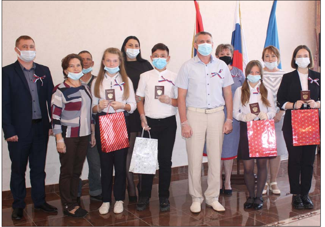
Получение государственного документа стало для ребят важным событием в жизни.