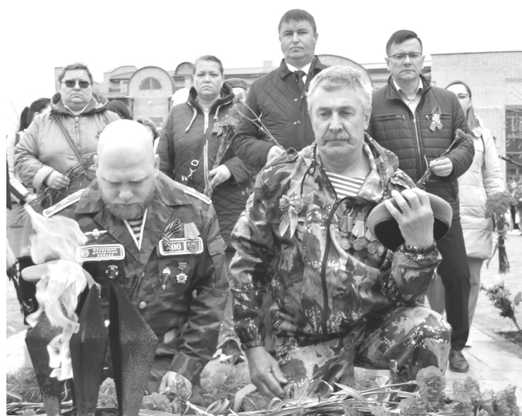
Почтить память земляков на торжественный митинг пришли ветераны и члены братств, руководители и сотрудники учреждений райцентра