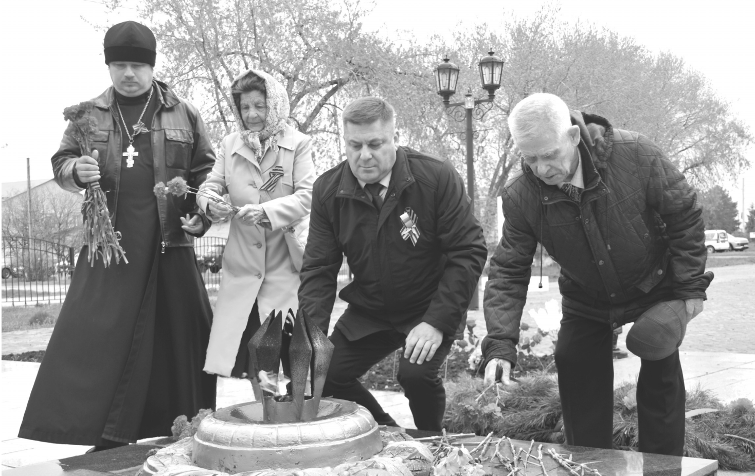
Цветы к мемориалу – дань уважения подвигу ветеранов Великой Отечественной войны, тружеников тыла