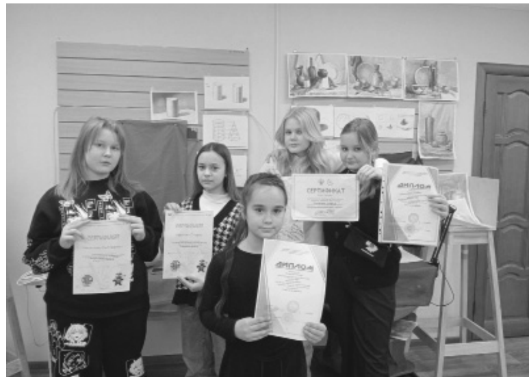
Воспитанницы художественного отделения с наградами – дипломами и сертификатами участников различных конкурсов и фестивалей