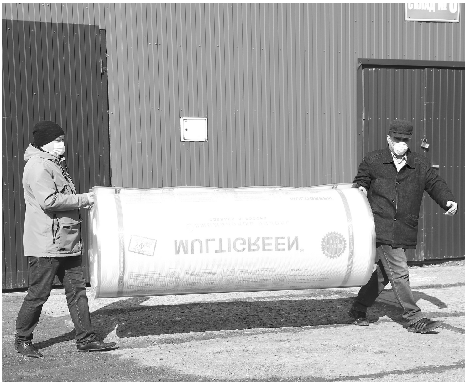
Востребованный весной товар – поликарбонат. Его из строительного магазина «Весна» доставят на дом, если клиент позвонит и сделает заказ