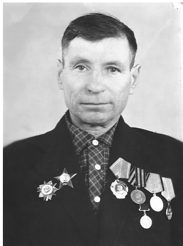
Первый бригадир первой тракторной бригады