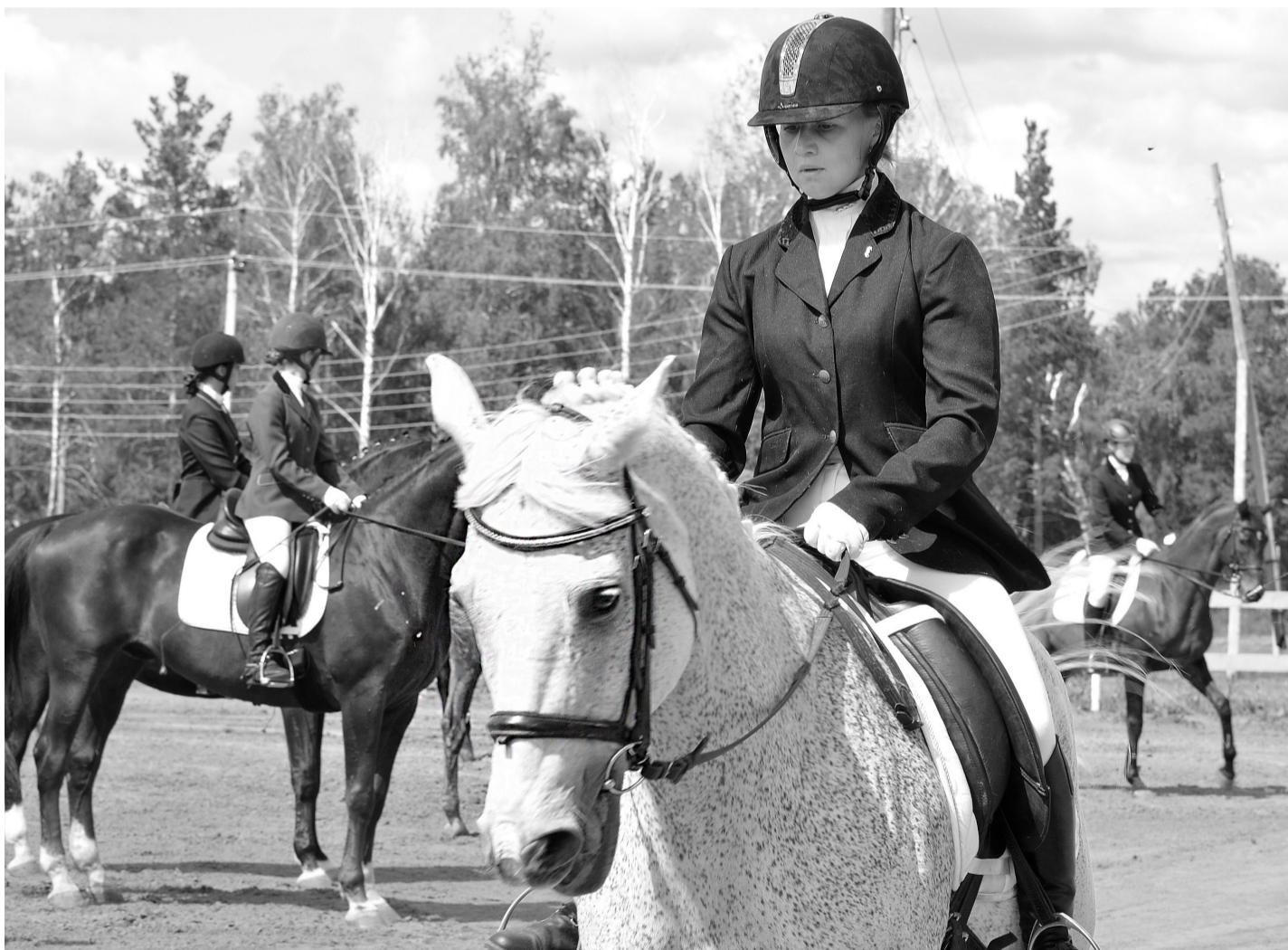
Как они красивы: и всадница, и лошадь! Как они горды этой своей красотой!

Открытый чемпионат и первенство Уральского Федерального округа по конному спорту стартовал 11 июня в Нижней Тавде. Три дня юниоры, юноши и дети вместе с их четвероногими подопечными соревновались в конкуре и выездке, которую ещё называют высшей шкалой верховой езды. А с 18 по 20 июня пройдут соревнования по троеборью, которое включает в себя манежную езду, конкур и полевое испытание.