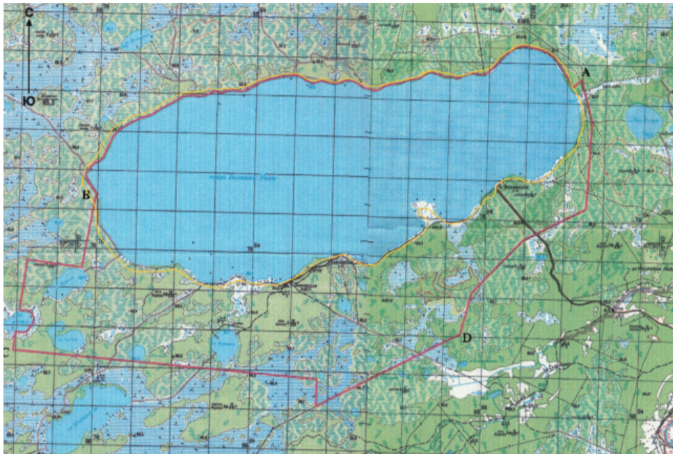
Обзорная карта территории памятника природы регионального значения «Озеро Большой Уват» М 1:150 000 — границы памятника природы, предлагаемые до проведения обследования — границы памятника природы после проведения обследования