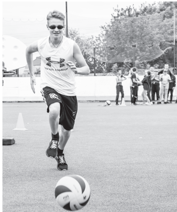
Быть на одной смене со спортсменами – стимул для ребят помладше заниматься спортом