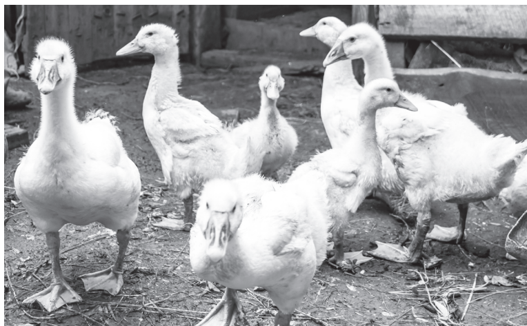
Без домашней живности в хозяйстве никак