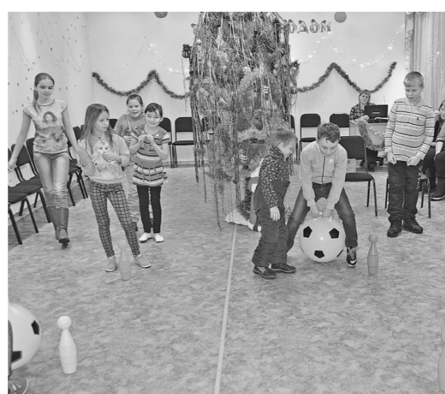
* А конкурсы очень понравились и мальчикам, и девочкам.

Недавно в Доме детского творчества для ребятшек с ограниченными возможностями здоровья под весёлую музыку прошла игровая программа под названием «Ура! Новый год!». Подростки были разделены на две команды – Снегурочка и Дедушек Морозов, то есть мальчиков и девочек. После этого с большим азартом и увлечением все приняли участие в различных конкурсах: «Танец Снегурочки», «Танец Петушка», «Украш ёлочку», «Снежный ком». Особенно ребятам понравился конкурс