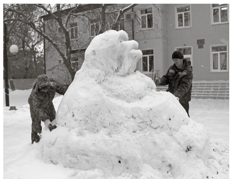
* Только зимой в нашем парке может появиться невиданный зверь из тёплых краёв.

Уважаемые выпускники! Лопазновская школа приглашает своих выпускников 2007, 1997, 1987 г.г. 4 февраля в 18-00 час. Администрация Лопазновской школы