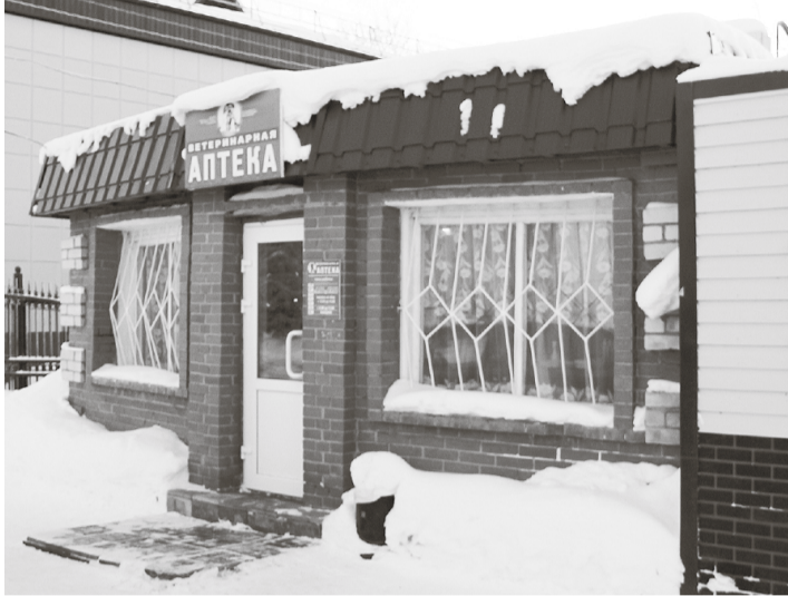
* Ветеринарная аптека необходима покупателям порой и днём, и ночью.