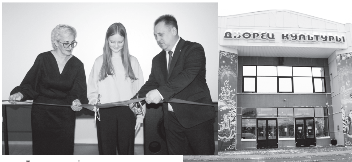
Торжественный момент открытия – перерезание красной ленты

Ольга КОНОВАЛОВА