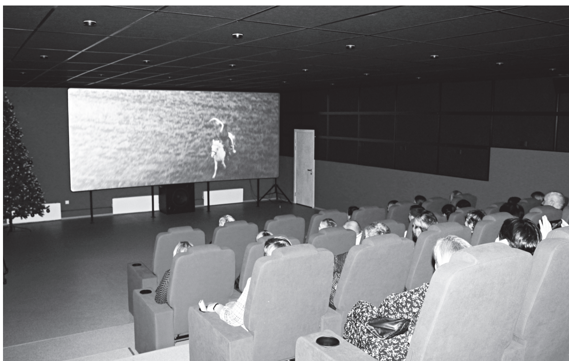
Первым фильмом стала семейная сказка «Баба Яга спасает мир»