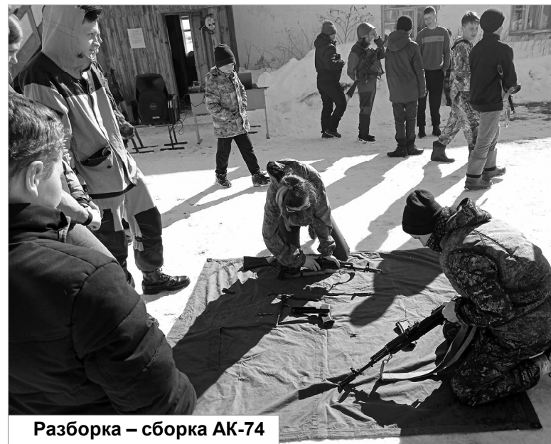
Разборка — сборка АК-74