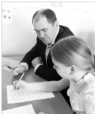
Папа Дима всегда поможет

мание присутствующих на том, что нельзя оставлять нерешённых заданий. Такое получилось у многих экзаменуемых, и все взяли «на вооружение» важное сообщение.