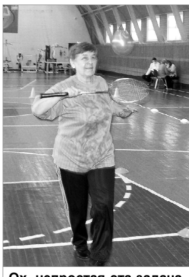
Ох, непростая эта задача

Спортивная встреча завершилась душевной беседой за чашечкой ароматного чая. Я поинтересовалась: «Не скучно ли на пенсии?». На что мне ответили, что унывают только те, кто не умеет организовываться.