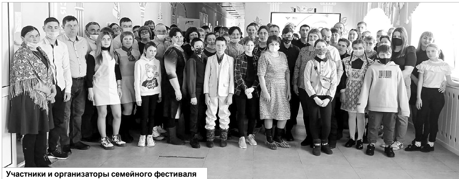
Участники и организаторы семейного фестиваля