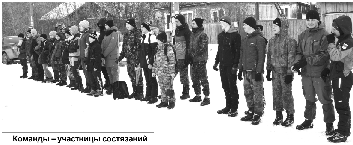
Команды — участницы состязаний

От автора: Увы, сейчас нередко слышишь разговоры о падении нравов, непуτεύой молодежи и мол, «вот в наше время...». Побывав на «Своем маршруте», я понял, что все далеко не так запущено: по крайней мере, не все, но многие курсанты спецгрупп — это настоящие «бойцы», которым не чужды такие понятия, как патриотизм, дисциплина, поддержка товарищей, командная работа... И здесь нельзя не отдать должное их руководителям, которые сумели поддержать, укрепить, а где-то даже и начать прививать эти качества. Дело не в подготовке к военной службе — это, своего рода, подготовка к жизни, и, как мне кажется, этими девчонками и мальчишками уже сделан достаточно серьезный и важный шаг, чтобы их дальнейший путь был успешным.