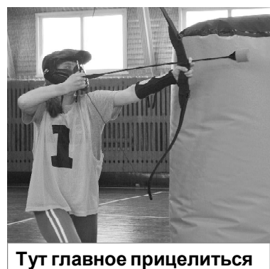
Тут главное прицелиться