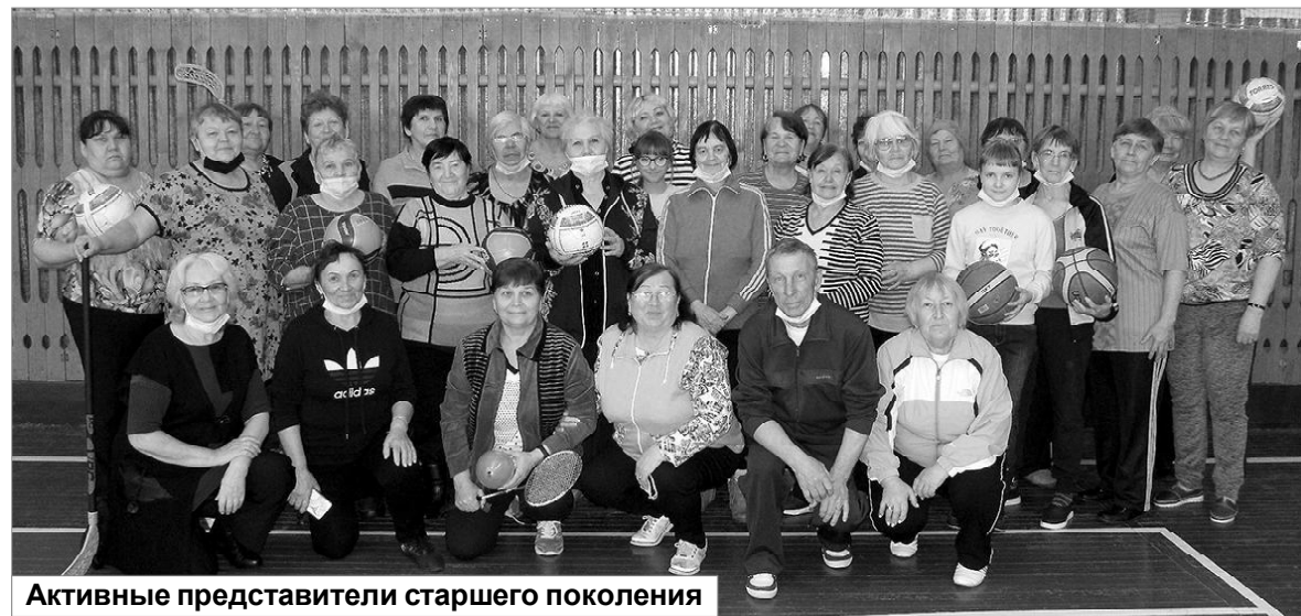
Активные представители старшего поколения