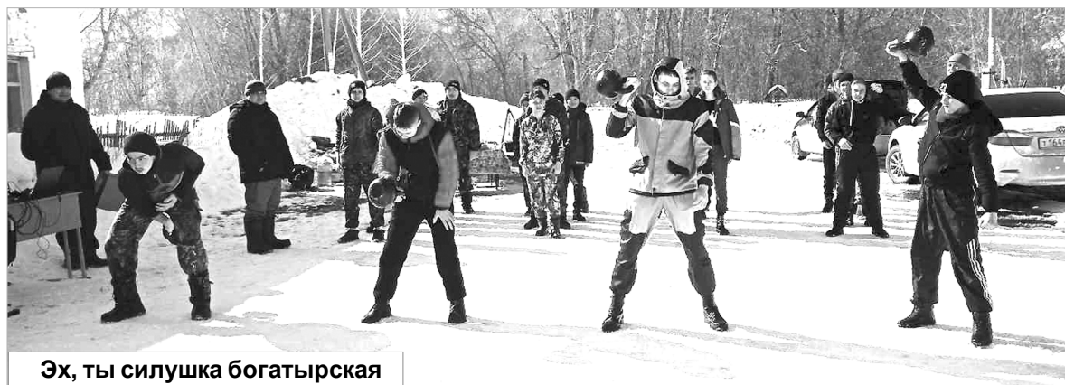
Эх, ты силушка богатырская