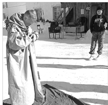
Облечься в ОЗК не так просто