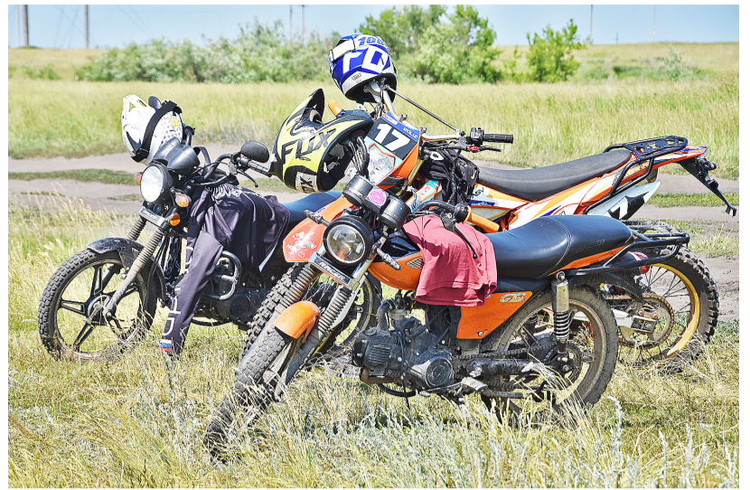
Питбайки и мотоциклы – это не только про скорость, но и про опасность

Движение по дорогам на велосипеде разрешено с 14 лет.