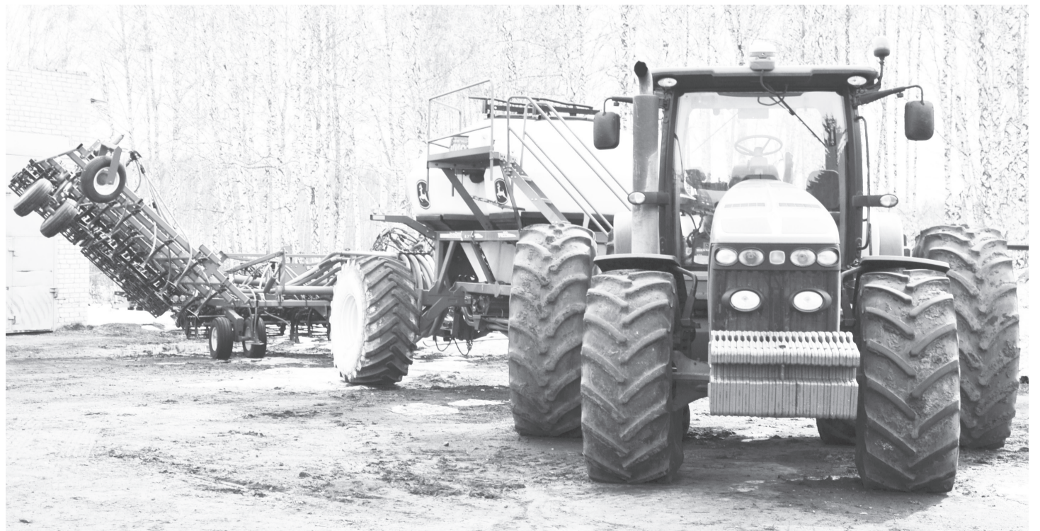
Тракторы, культиваторы и посевные комплексы к работе готовы.

– В этом году «Нива-Агро» не будет выращивать рапс, вместо него мы посеём 600-700 гектаров гороха. Для производства приобретены пять новых культиваторов и два опрыскивателя. Горюче-смазочные материалы и минеральные удобрения для проведения весенне-полевых работ закуплены полностью. Семена прошли сертификацию. На этой неделе рабочие предприятия будут заняты протравливанием семян.