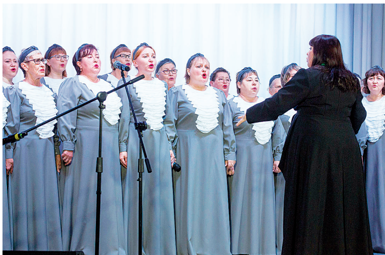
► Сводный хор Тобольского района

Реконструкция Загваздинского сельского клуба стала возможной благодаря нацпроекту «Культура», проекту «Единой России» «Культура малой родины» и поддержке губернатора Тюменской области. А всего за последние 5 лет после модернизации в регионе открыто 13 модельных библиотек, введено в эксплуатацию 12 центров культурного развития, создано 34 виртуальных концертных зала, открыто 17 кинозалов и обеспечены инструментами все 28 детских школ искусства