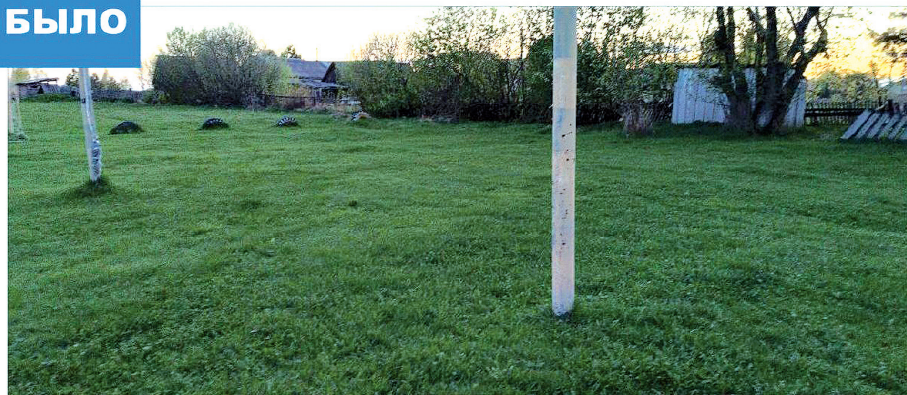
Фото Ушаровского сельского поселения