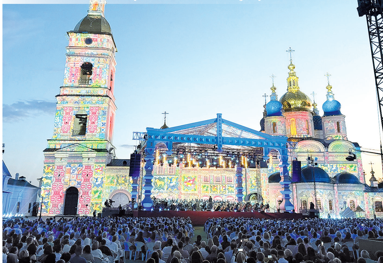
► Лето в кремле – 2024

«Лето в Тобольском кремле» в 2025 году пройдёт с 5 по 12 июля