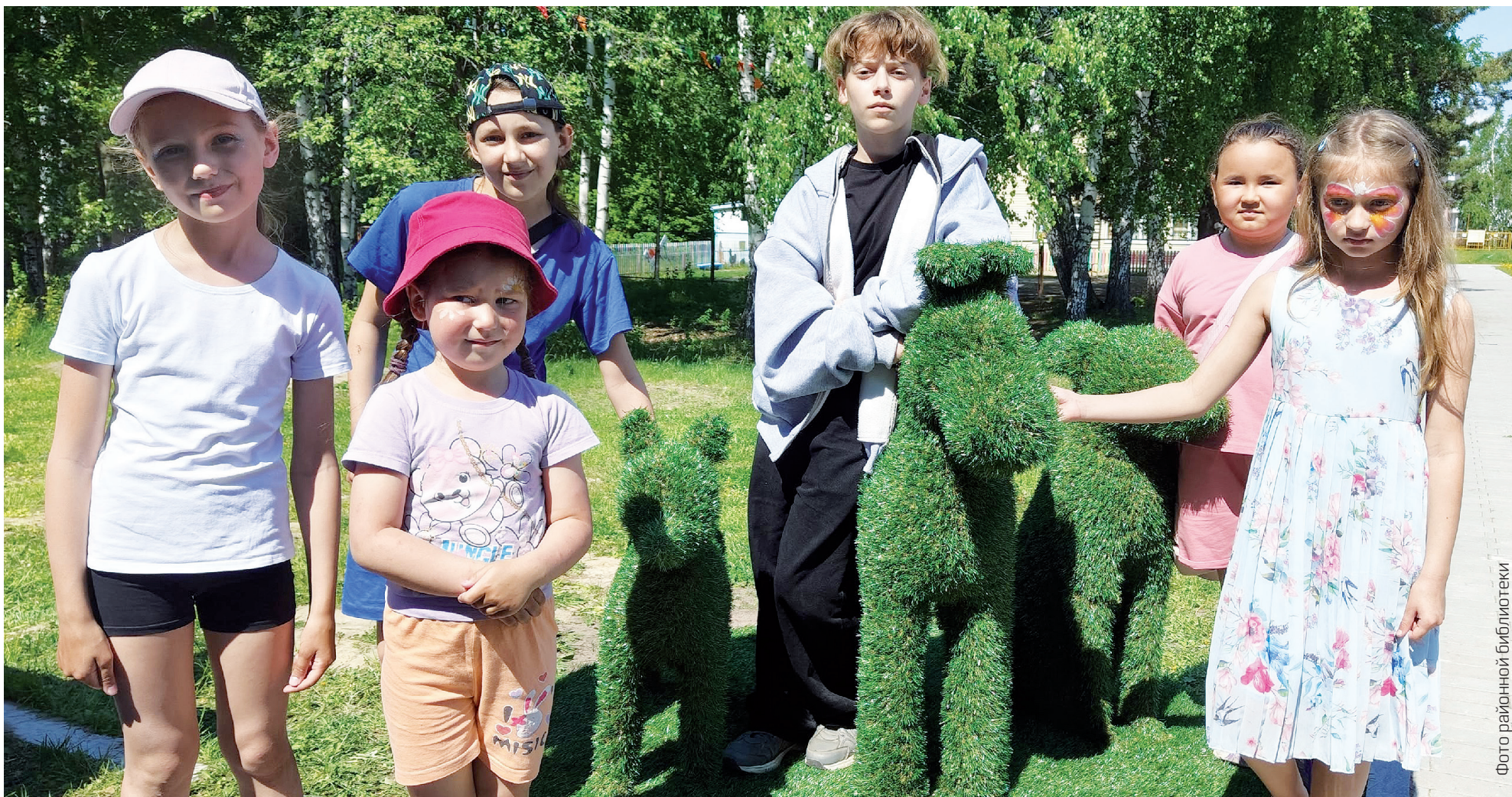
Фото районной библиотеки