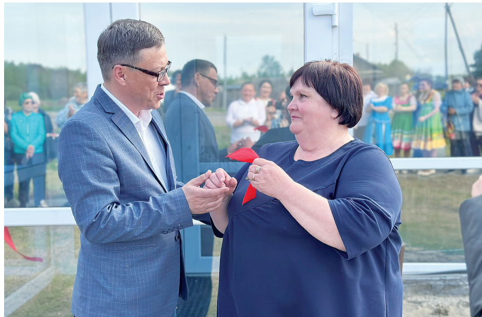
Фото Кутарбитского поселения

жения, возведение которое является пилотным проектом в Тобольском районе, в том, что оно легко трансформируется под любые мероприятия, здесь можно проводить концерты и молодёжные дискотеки, приглашать на мастер-классы, заниматься в клубах по интересам. Внутри его расположены посадочные места, современная и световая техника, к услугам зрителей – огромный экран для просмотра видео и кинофильмов, а также небольшая сцена для концертов. Новая культурная площадка обещает стать излюбленным местом проведения отдыха и досуга для каждого человека: