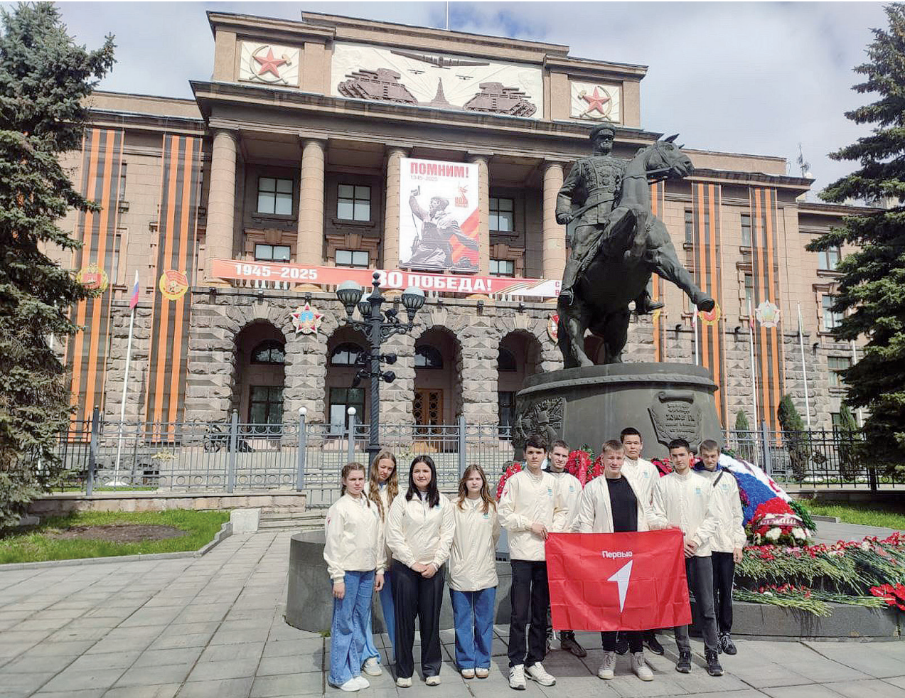
Школьники из Байкалово на экскурсии по Уралу

← 8 чтобы погрузиться в боевую историю отечественной военной техники, познакомиться с объектами истории, культуры. Приехав в Екатеринбург, юные туристы и педагоги совершили автобусную обзорную экскурсию, во время которой смогли увидеть знаковые памятники города – маршалу Жукову, «Чёрный тюльпан», 37-му пехотному