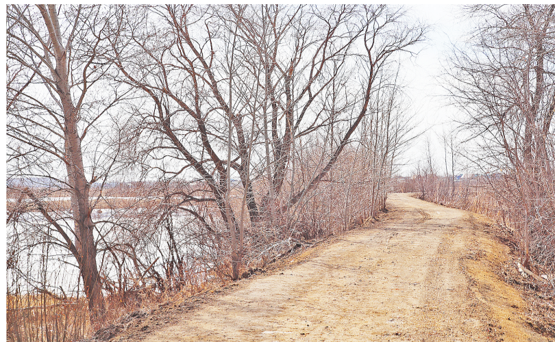
Дамба, расположенная в конце улицы Советской, находится в удовлетворительном состоянии

Талой воды не достаточно для нужного увлажнения почвы, не улучшит ситуацию и Сергеевское