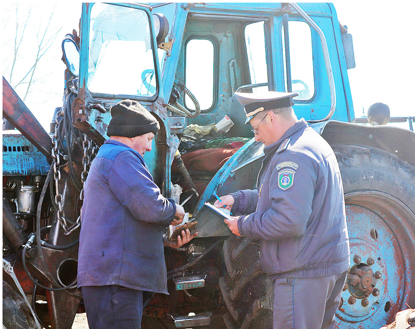
Механизаторы ООО «Сельхозинтеграция» качественно подготовились к весенне-полевым работам

В преддверии весенних полевых работ проводятся технические осмотры