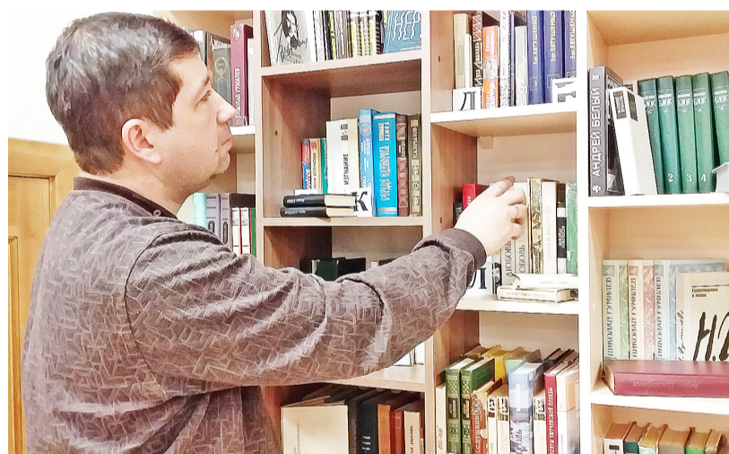
Хорошая книга не только скрасит серые будни, но и подарит массу приятных впечатлений