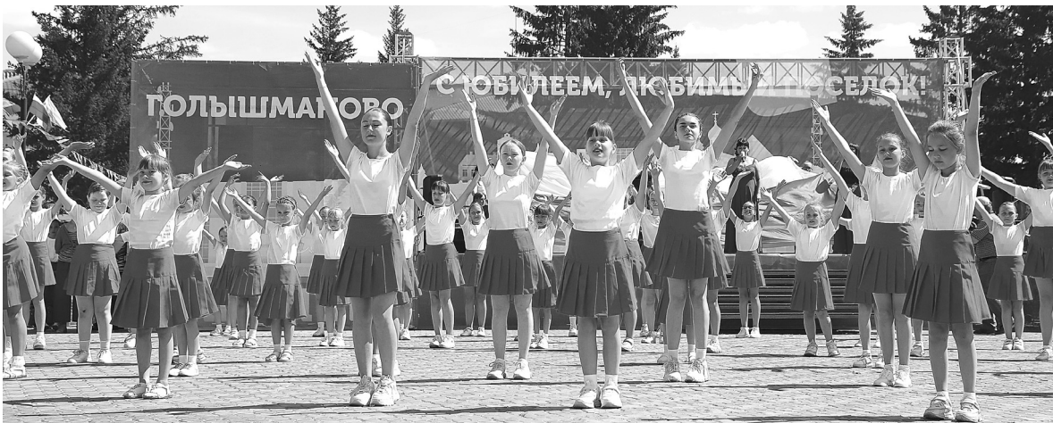
Несколько ярких флешмобов подготовили юные жители для юбилея