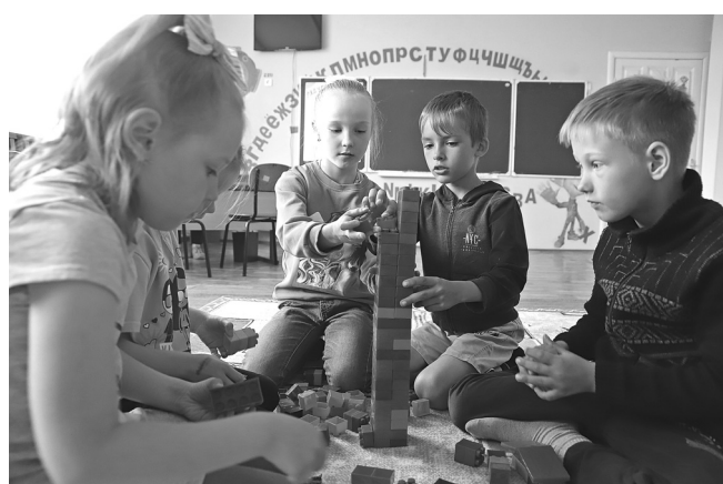
Конструирование «Лего» – самое популярное занятие у медведевских ребят в пришкольном лагере во время «тихого» часа

В школах Голышмановского округа работают 14 лагерей с дневным пребыванием