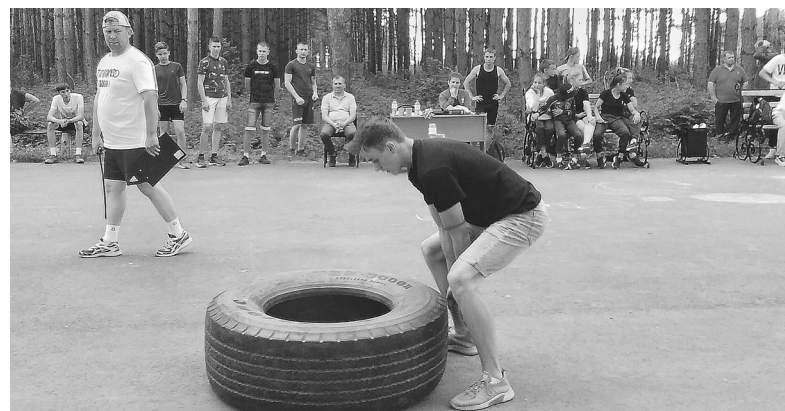
Поднять шину весом 25 килограммов – испытание не для слабых