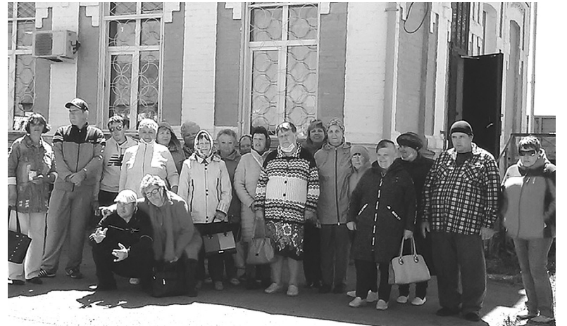
Игру-экскурсию по истории посёлка для участников общества инвалидов начали с железнодорожного вокзала