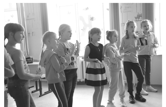
В отряде «ДИНО» – громкая музыка и задорные танцы. Все дружно вышли на танцпол