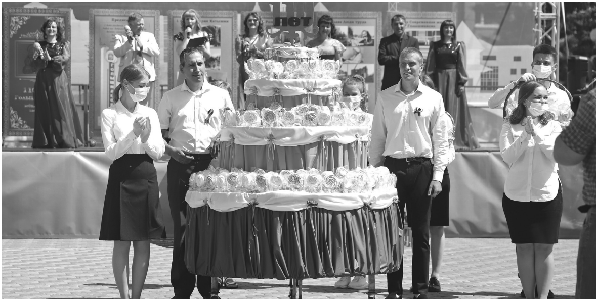
Тортом, составленным из пирожных, угощались гости на дне рождения посёлка Голышманово