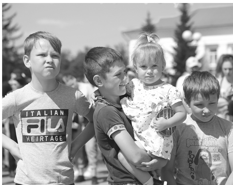
Дети участвовали во всех праздничных мероприятиях