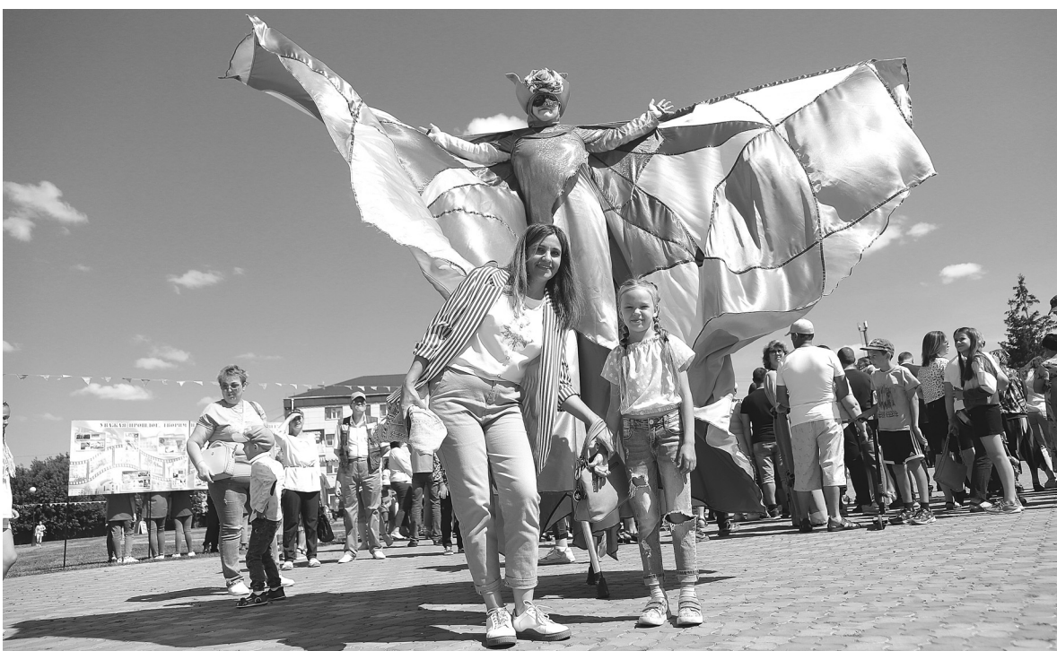
Красочности и необычности праздничной программе добавляли ходулисты – веселили участников народного гуляния

Торжественный концерт 12 июня на центральной площади в честь 110-летия посёлка Голышманово собрал людей разных поколений и национальностей.