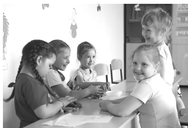
Учащиеся школы № 2 утверждают, что в «Стране чудес» отдыхается весело, интересно и вкусно