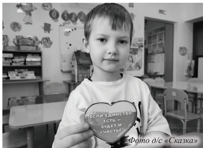
Фото д/с «Сказка»

Ключевой принцип таких занятий – тема единства раскрывается в доступных для детей формах, без политического подтекста. Она воплощается через близкие и понятные категории: дружбу, семейные ценности, народные сказки, игры, музыку, национальные костюмы, праздники и