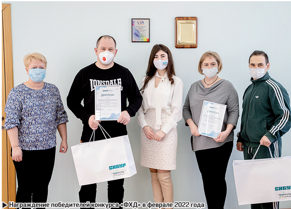
► Награждение победителей конкурса «ФХД» в феврале 2022 года

Принять участие в конкурсе грантовых проектов могут бюджетные учреждения и некоммерческие организации. Дополнительным преимуществом будет соответствие