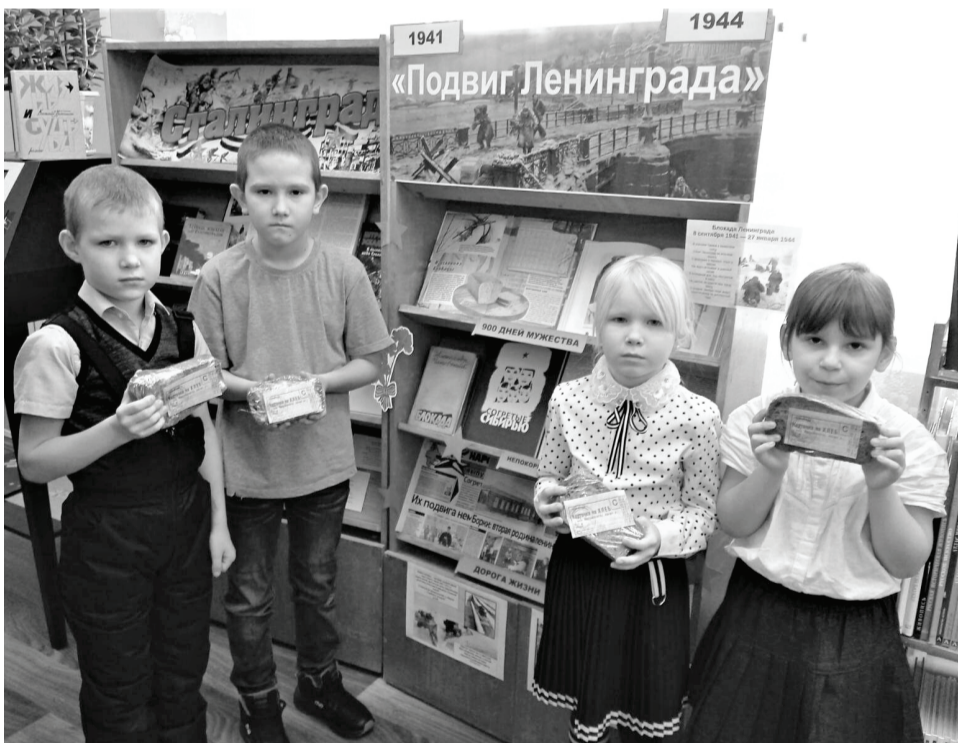
Акции, уроки памяти, часы мужества – юное поколение района изучает историю своей страны, помнит и чтит подвиги народа.

В преддверии дня воинской славы повсеместно