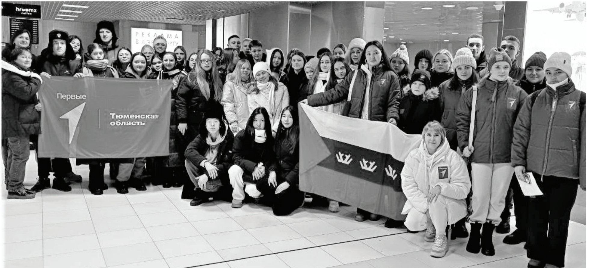
Активные, целеустремлённые школьники посетили масштабную выставку достижений нашей страны.

Сладковская делегация активистов «Движения первых» съездила в Москву на выставку «Россия», которая действует на ВДНХ и представляет достижения всех регионов нашей страны.