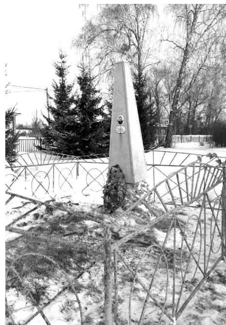
➤ Памятник Ефимову, с. Озерное // Фото из архива отделения Озернинской школы