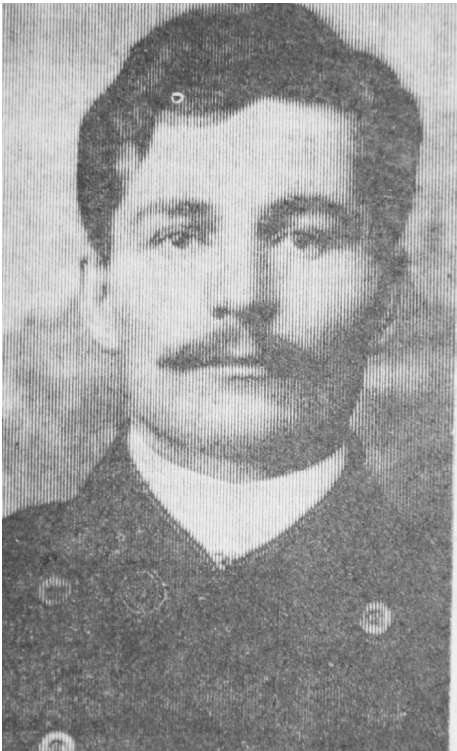
➤ Александр Михайлович Ефимов

в ходе которого убили секретаря волисполкома