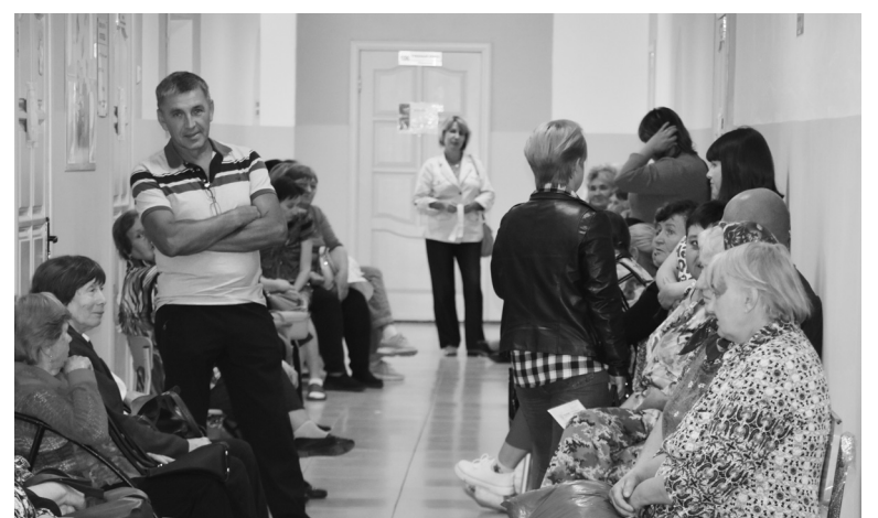
Работа шла в плотном графике: везде было много пациентов