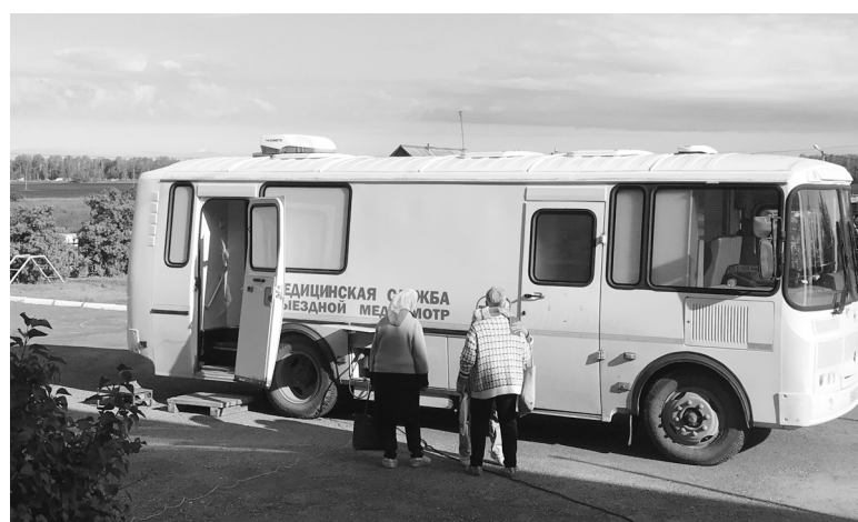
В специальном автобусе медицинской службы селяне проходили флюорографию и маммографию