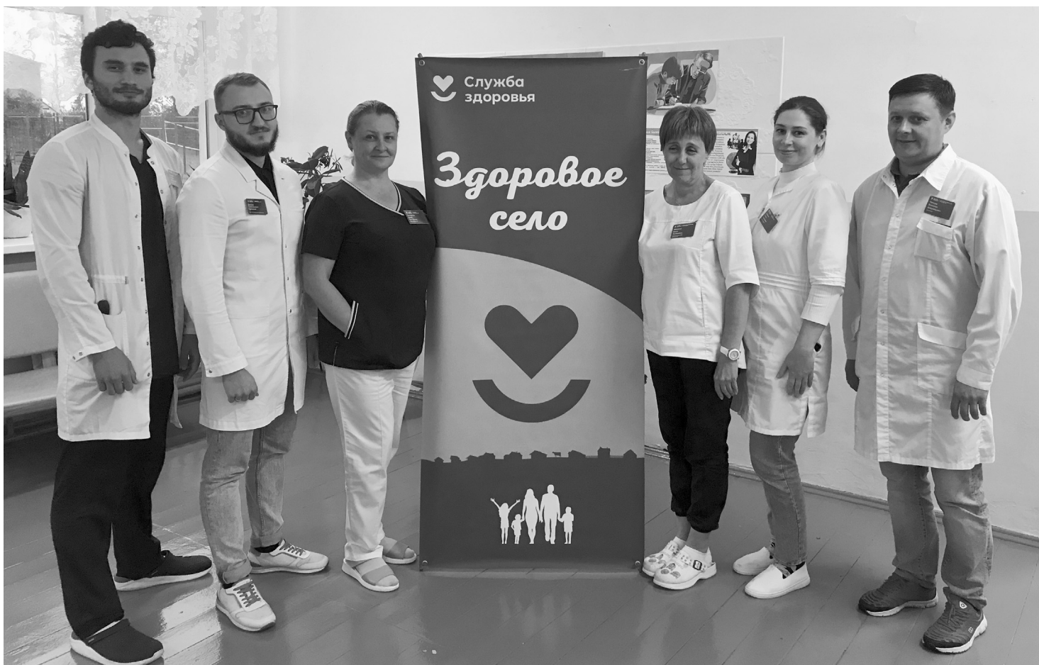
В составе выездной бригады - доктора тюменских клиник