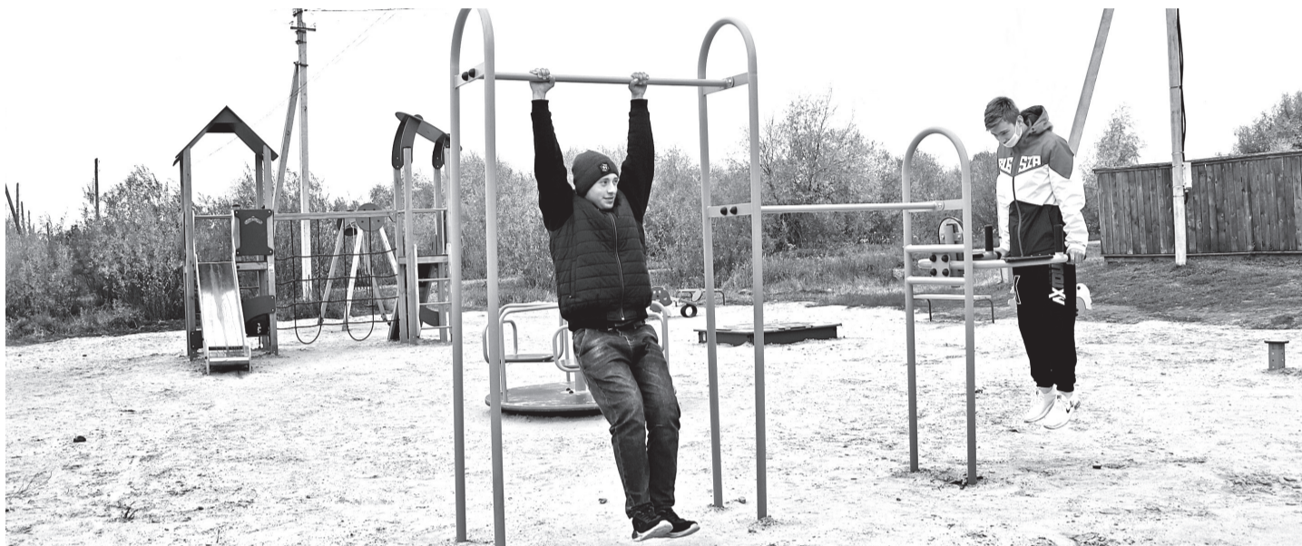
• В деревне Пономарёвой у остановки появилась детская площадка со спортивными тренажёрами. Тюменская фирма смонтировала её в кратчайшие сроки. Игровую зону осталось только обнести забором. Сельская администрация планирует сделать это в следующем году.