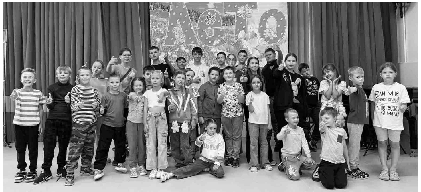
Воспитанники лагеря в предвкушении квеста «Лето - это круто»