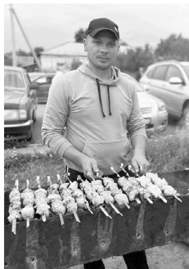
Аромат от шашлыков разносился по всей площади