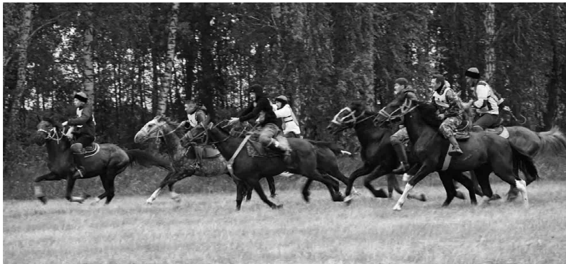
Жеребцы при игре в кокпар должны быстро маневрировать, не бояться столкновений с другими животными и точно выполнять команды всадников

В GAZ-ОПТИКЕ каждый четверг ведет прием ВРАЧ-ОПТОМЕТРИСТ! Подбор очков и линз любой сложности на компьютере. Есть все, что нужно ДЛЯ ВАШИХ ГЛАЗ! Наш адрес: с. Омутинское, ул. Шоссейная, 48, ТЦ «Петр I» (2 этаж), тел. 8-922-261-25-29