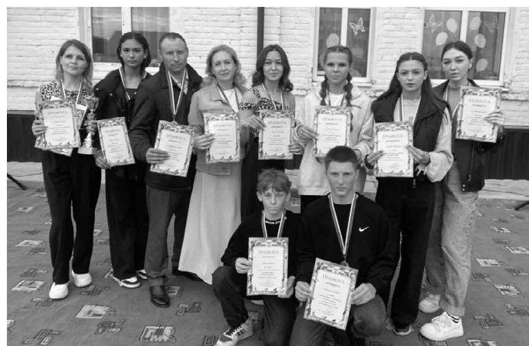
Команда по летнему полиатлону ситниковского поселения на празднике получила заслуженные награды за 1-е место в районе