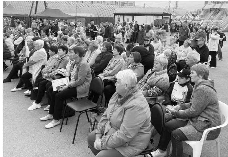
Ситниковцы с удовольствием смотрели праздничную программу, организованную сельским Домом культуры